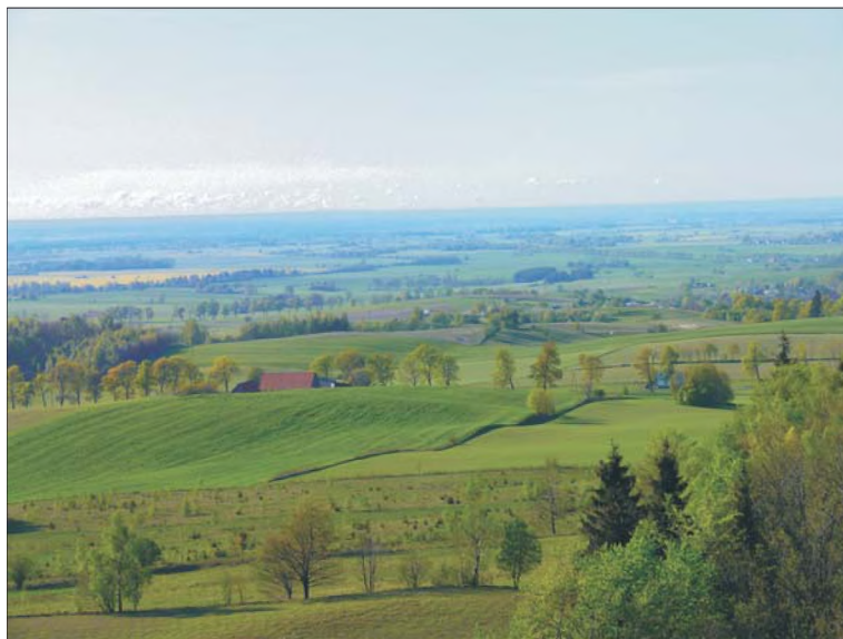
Rys. 2. Panorama z wieży obserwacyjnej na Górze Dylewskiej w kierunku południowo-zachodnim