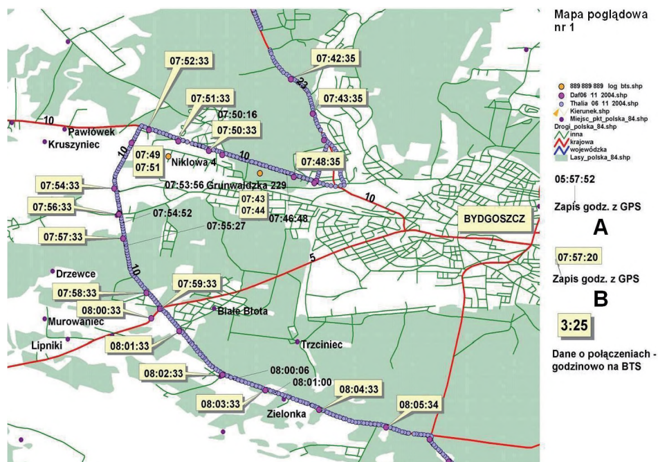
Rys. 1. Trasa przemieszczania się pojazdów