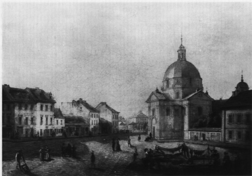
5. Kościół Sakramentek na Nowym Mieście, poz. kat. 6

6. KOŚCIÓŁ SAKRAMENTEK NA NOWYM MIEŚCIE (Rynek Nowomiejski z kościołem PP. Sakramentek, Nowe Miasto w Warszawie z widokiem na kościół Sakramentek)