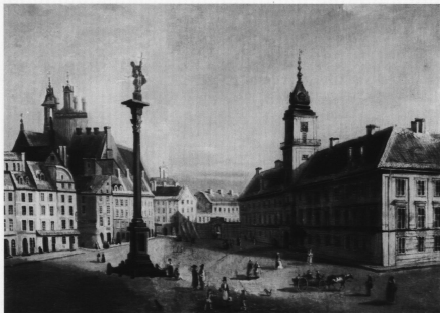
4. Plac Zamkowy , poz. kat. 5

szy był również samodzielnym dziełem Jana Seydlitza (jak zapisano w inwentarzu MNW), wówczas jeszcze ucznia Szkoły Sztuk Pięknych. Istniał drugi, niemal identyczny z niniejszym obraz, który zaginął (znany z fotografii — nr neg. MNW 14653). Nasuwa się przypuszczenie, że jeden z tych obrazów to oryginał pędzla nieznanego artysty, a drugi może być kopią wykonaną przez Jana Seydlitza. Seydlitz podpisywał kopie przez siebie wykonane (por. kopię z Kasprzyckiego, poz. kat. nr 4), w tym przypadku sygnatura mogła ulec zniszczeniu. Jeden z tych dwóch identycznych obrazów próbowano zidentyfikować (por. Widoki architektoniczne, uwagi przy nr 47) z zaginionym obrazem sygnowanym: „Jan Seydlitz 1854” — poz. kat. nr 3.