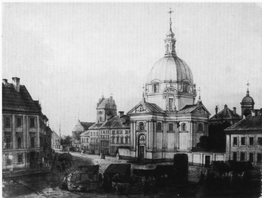
13. Rynek Nowomiejski z kościołem pp. Sakramentek, poz. kat. 16