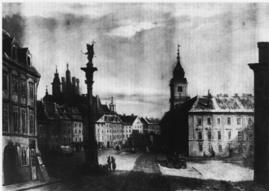
1. Plac Zamkowy , poz. kat. 1