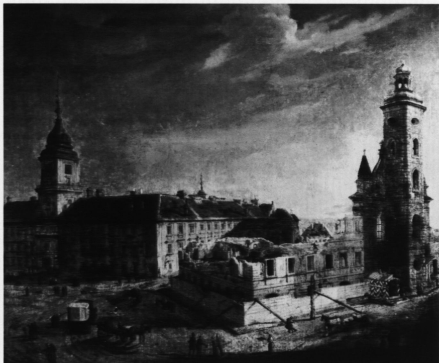
3. Rozbiórka kościoła Św. Klary i klasztoru Bernardynek, poz. kat. 4

balustradą — por. poz. kat. 9). Obrazy poz. kat. nr 2 i nr 9 należą do niewielu przekazów ikonograficznych rejestrujących zmiany, jakie zaszły w wyglądzie ryzalitu wieży Grodzkiej w 1858 r. (obraz poz. kat. 2 nie został wykorzystany przez J. Lileykę).