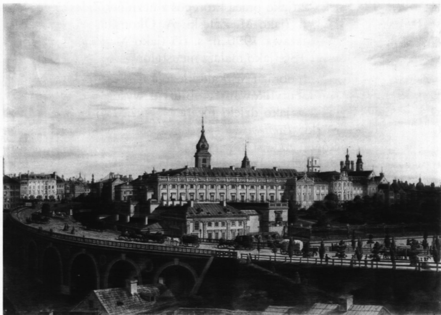
8. Zamek i wiadukt Pancera, poz. kat. 9

nr 94, il.; Kat. wystawy MHW w Belgradzie, 1976, nr 12; Varsavia , nr 272, il.; Encyklopedia Warszawy , Warszawa 1994, il. s. 777.