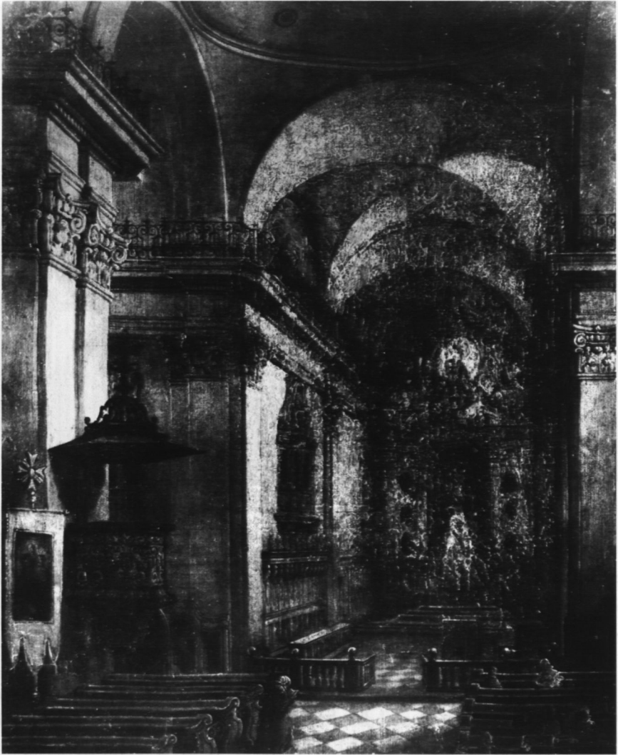
12. Wnętrze kościoła Św. Krzyża, poz. kat. 15