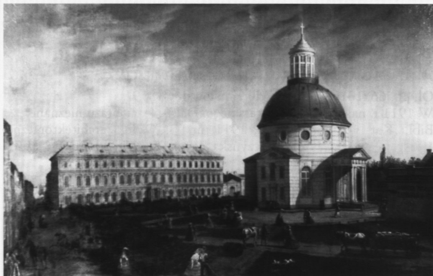
15. Kościół Ewangelicki , poz. kat. 18

18. KOŚCIÓŁ EWANGELICKI (Widok placu przed kościołem Ewangelickim w Warszawie, Plac Ewangelicki od ul. Królewskiej)