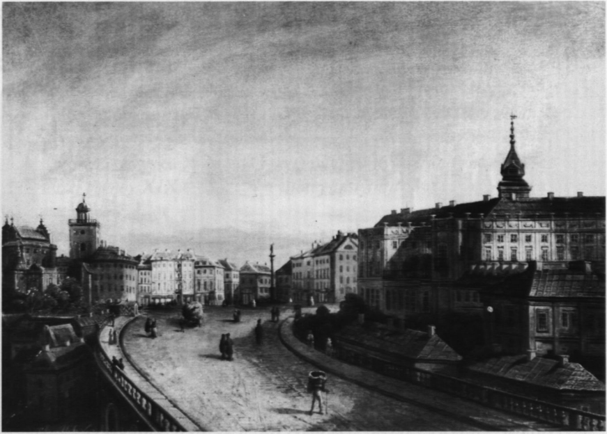
2. Zamek i wiadukt Pancera, poz kat. 2