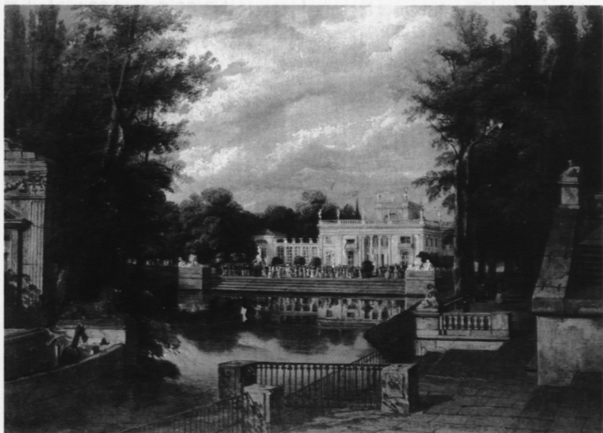
6. Łazienki, poz. kat. 7