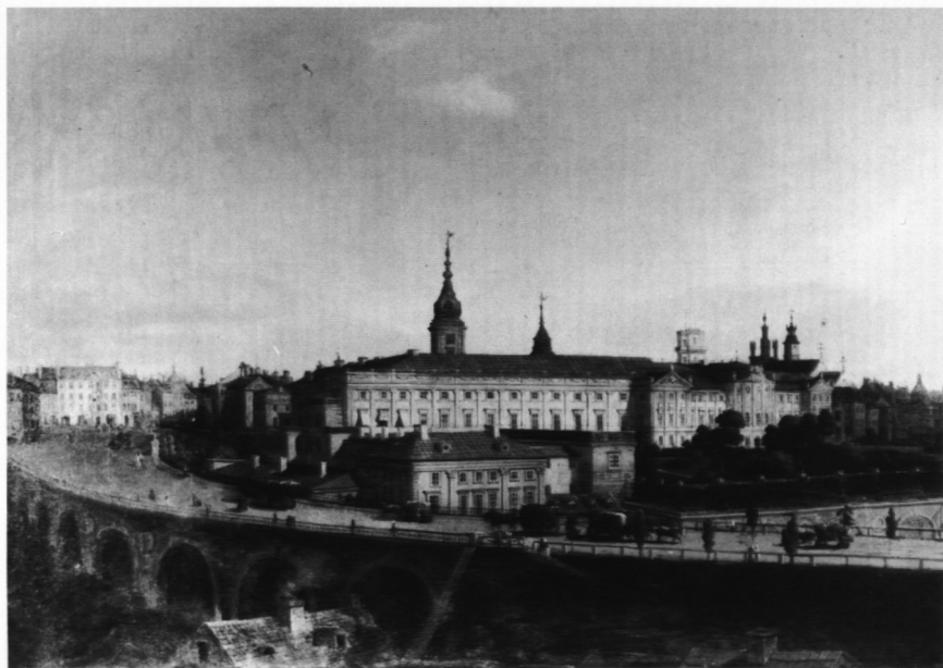
9. Zamek i wiadukt, poz. kat. 10

Warszawa, 1937, s. 15; Tessaro, Warszawa w obr. i rys., 1957 — uwagi przy nr 38; Widoki architektoniczne, 1964 — uwagi przy nr 51; Sroczyńska, Jaworska, Widoki Zamku, s. 156, il.; Straty wojenne. Malarstwo polskie. Obrazy olejne, pastele, akwarele utracone w latach 1939–1945 w granicach Polski , po 1945, Poznań 1998, nr 321.