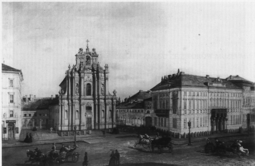
16. Krakowskie Przedmieście z kościołem Wizytek i pałacem Potockich, poz. kat. 20

J. A. Chrościcki, Kościół Wizytek , Warszawa 1973, fot. nr 36). (W 1917 r. Tygodnik Ilustrowany donosił, że z malowanych szyldów warszawskich nie pozostało już ani śladu — por. W. Perzyński, Małe szyldy , „Tygodnik Ilustrowany”, 1917, I, nr 43, s. 530).