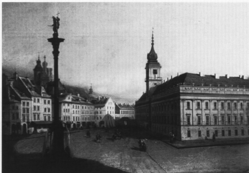
10. Plac Zamkowy od strony Krakowskiego Przedmieścia, poz. kat. 12