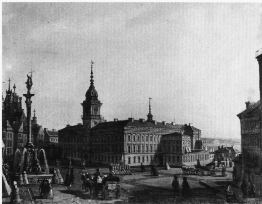
11. Widok Placu Zamkowego , poz. kat. 14

Prawie identyczne wymiary z obrazem W. Kasprzyckiego pod tym samym tytułem (wł. MNW, nr inw. — MP 4919) pozwala przypuszczać, że jest to kopia obrazu Kasprzyckiego, kopię fragmentu którego wykonał J. Seydlitz w 1854 r. (por. poz. kat. 4).