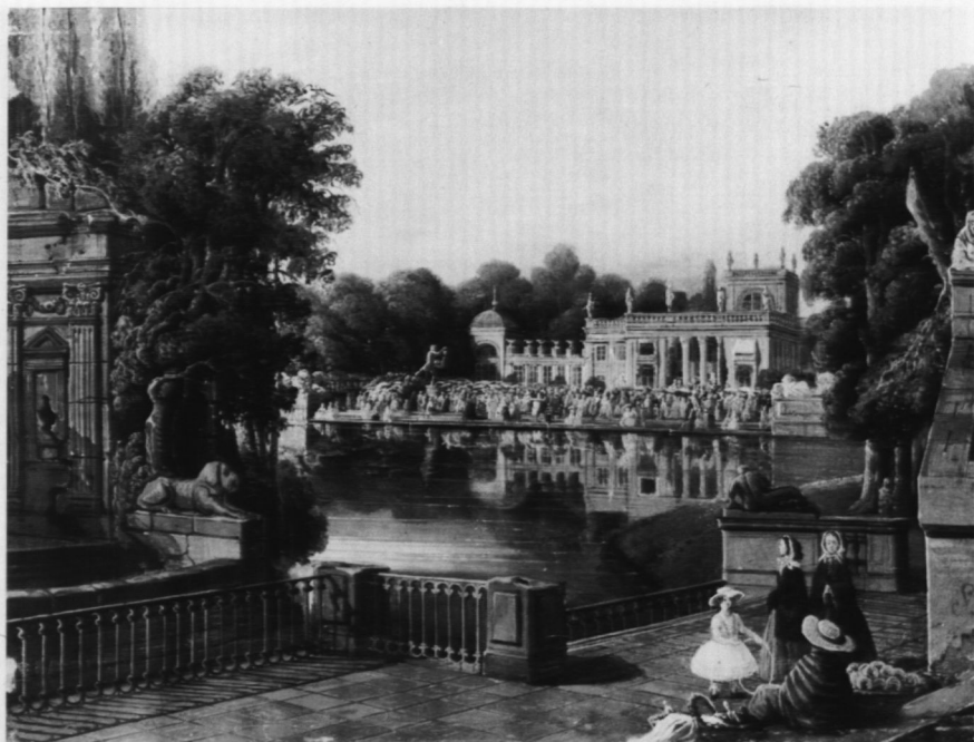
14. Łazienki w czasie festynu, poz. kat. 17