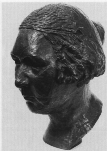
Głowa nieokreślonej kobiety