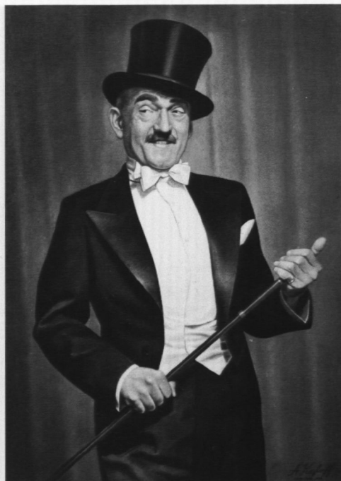
Portret Ludwika Sempolińskiego

Laseczka, z którą sportretowany został Sempoliński znajduje się w zbiorach Muzeum (zob. Rzemiosło artystyczne).