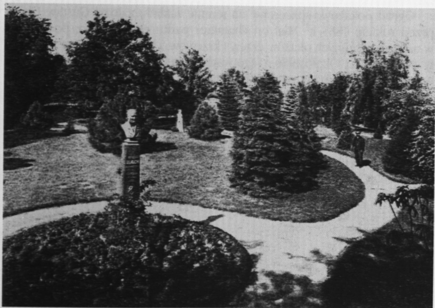
2. Ogródek spacerowy z pomnikiem założyciela szkółek w Górcach, 1904 r.