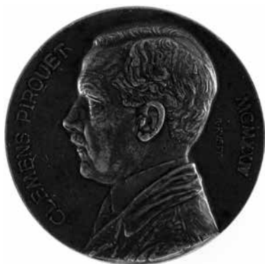
7. Artysta nieznanym, Clemens von Pirquet, 1924, brąz