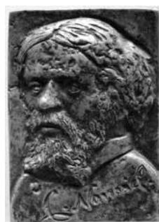
4. Artysta nieznaný, Cyprian Kamil Norwid , ok. 1900, brąz