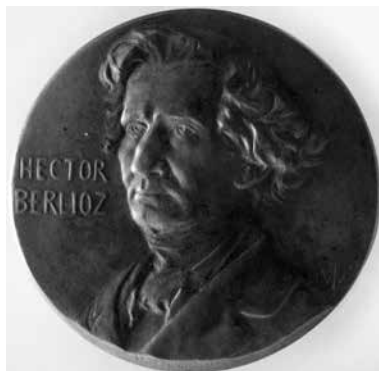
1. Wincenty Trojanowski, Hector Berlioz , 1897, brąz