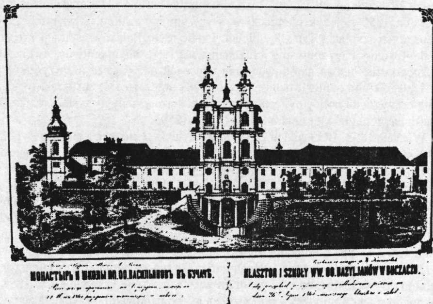
Il. 2. Fronton zabudowań klasztoru i szkół ukraińskich OO. Bazylianów w Buczacu. Rok 1865.