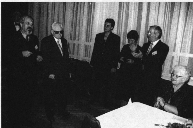
Ryc. 6. Uroczysta kolacja z okazji VIII Sympozjum Historii Farmacji – Błażejewko k/Poznania 23.09.1999 r.