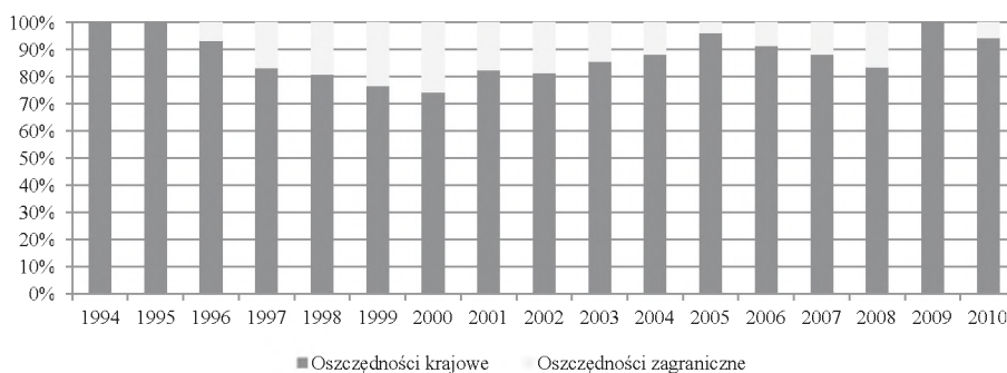
Rysunek 1. Udział procentowy w finansowaniu inwestycji krajowych oszczędności krajowych oraz oszczędności zagranicznych w Polsce w latach 1994–2010

Inwestycje krajowe w Polsce w latach 1994–2010 były w przytłaczającej wielkości finansowane oszczędnościami krajowymi. Stopień pokrycia średniorocznych inwestycji krajowych oszczędnościami krajowymi wynosił w tym okresie średniorocznie około 89%. Zmiany udziału procentowego finansowania inwestycji przez oszczędności krajowe oraz zagraniczne (różnica między inwestycjami krajowymi a oszczędnościami krajowymi) w Polsce w okresie od 1994 do 2010 roku przedstawiono na rysunku 1. Z kolei na rysunku 2 pokazano kształtowanie się inwestycji i oszczędności krajowych w relacji do PKB.