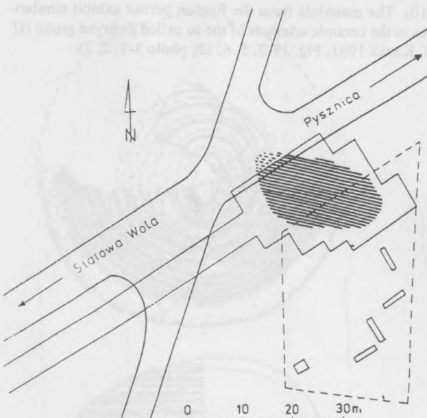
Ryc. 1. Pysznica, woj. Tarnobrzeg, stan. 1. Plan sytuacyjny cmentarzyska grupy tarnobrzeskiej (obszar ukośnie zakreskowany). Linia ciągłą oznaczono obszar objęty badaniami w latach 1974, 1991 i 1996, a linią przerywaną teren działki przewidzianej pod zabudowę w 1996 r.

Celem badań podjętych w 1996 roku była eksploatacja kolejnej partii stanowiska i w miarę możliwości, uchwycenie granic nekropoli od południa i wschodu. Prowadzono je w maju, w trybie ratunkowym spowodowanym rozpoczęciem zabudowy parceli, na której występowały groby. W związku z tym dodatkowym problemem było rozpoznanie startygrafii w części objętej planami inwestycyjnymi, a leżącej już poza zasięgiem cmentarzyska.