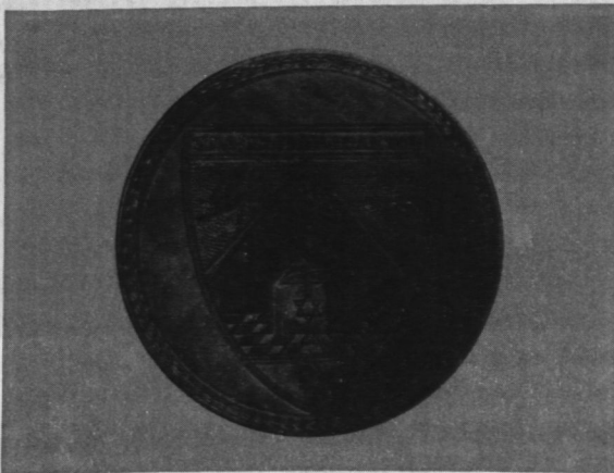
Pieczęć (kość słoniowa, herb grawerowany w masie perłowej), 1806 r. Własność loży „Święta Elżbieta” w Kantonie.