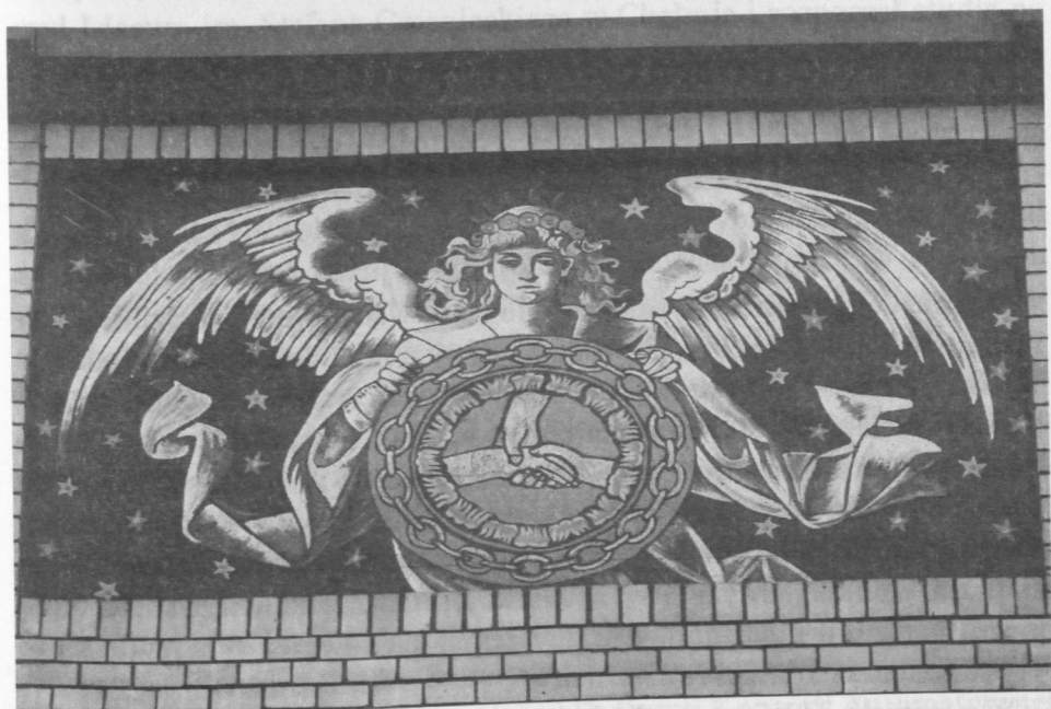
Wyobrażenia symboliki wolnomularskiej usytuowane w supraportach zdobiących budynek loży.