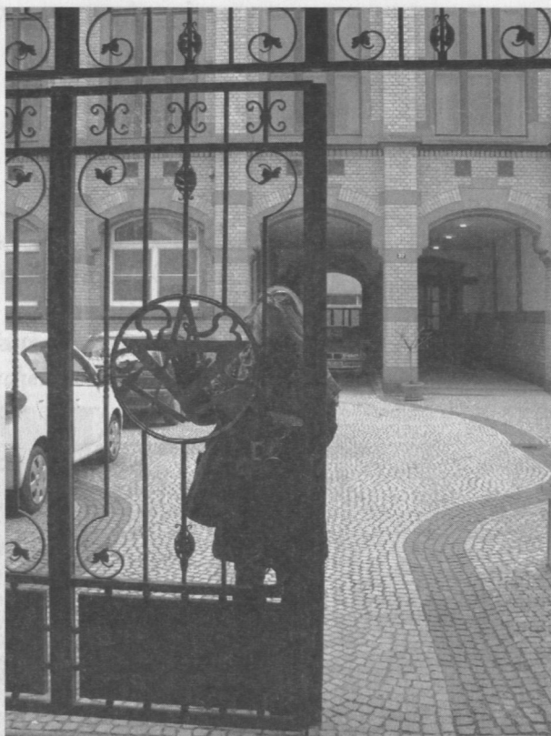
Kuta żelazna brama wiodąca na dziedziniec wewnętrzny loży, ozdobiona symbolami wolnomularskimi.