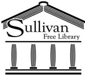
Il. 12. Logo Sullivan Free Library