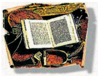
Il. 9. Logo Kazakstan Respublikacynyn Ultyk wykorzystywane w pierwszych latach funkcjonowania strony domowej WWW

Jeśli chodzi o współwystępowanie książki z elementami narodowymi, przykładem znaku, w większym stopniu zbliżonego do herbu niż do logo, był wykorzystywany do 2009–2010 roku sygnat Biblioteki Narodowej Republiki Kazachstanu (Kazakstan Respublikacynyn Ultyk, il. 9). Pojawiało się w nim oprzyrządowanie konia, mające być nawiązaniem do kazachskiego folkloru. Także autorzy nowego logo tej instytucji czerpali z historii narodu, ponieważ wypracowali kształt składający się z wzajemnie nachodzących na siebie obrysów książki i jurty. Mimo ciekawego pomysłu kazachska biblioteka nieczęsto posługuje się logo. Godła brak