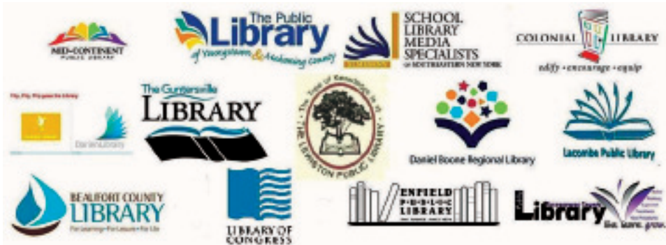
Il. 8. Zrzut ekranowy pierwszej strony grafiki wyszukiwarki internetowej Google Źródło: Google, http://www.google.pl/search?q=library+logo&um=1&ie=UTF-8&tbs=isch&source=og&sa=N&hl=pl&tab=wi&biw=1280&bih=687 [dostęp: 13.05.2011].

Po wpisaniu w przeglądarce Google frazy „logo biblioteki” lub „library logo” z trudem można w zalewie godeł odnaleźć takie, w których motyw książki nie występuje. Pobieżna obserwacja wykazała, że ze stu pierwszych wyświetlonych sygnatów około 80% zawierało element nawiązujący formą do woluminu. Książka przy zastosowaniu różnych artystycznych środków wyrazu pokazywana jest w najrozmaitszych kombinacjach i kolorystyce (il. 8) oraz kompozycjach z innymi obiektami, np. związanymi z kulturą narodową, nowymi technologiami bądź architekturą budynków bibliotecznych.