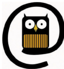
Il. 11. Logo Kilkenny County Library

Z kolei znak graficzny Dunedin Public Library na Florydzie (il. 10) zawiera otwartą książkę, zestawioną z atrybutem nowoczesności: dyskiem optycznym oraz atrybutem dążenia do poznania (wiedzy): kluczem. Ponadto tę nad wyraz czytelną – by nie rzec: banalną – metaforykę wzbogacono jeszcze sloganem „Keys to the Past... Gateway to the Future”. Zbliżoną logikę przyjęła Kilkenny County Library w Irlandii, lecz klucze i CD zastąpiły sowa i znak @, rząd książek zaś złożył się na korpus ptaka (il. 11).