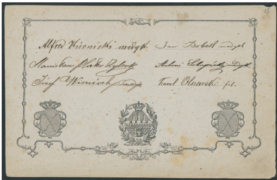
Il. 7. Karta z podpisem Karola Stanisława Olszewskiego (1846–1915)

Z określeniem przy nazwisku „filozof” lub „sł[uchacz] filozofii” wpisało się 37 osób. Wśród nich znalazł się Karol Stanisław Olszewski (1846–1915, il. 7), wybitny chemik i kriogenicznik, cieszący się bardzo dużym uznaniem w międzynarodowym środowisku naukowym. Studiował w Krakowie (w 1873 roku został docentem chemii) i Heidelbergu (w 1872 roku otrzymał dyplom doktora filozofii). Związał się z Uniwersytetem Jagiellońskim, gdzie od 1891 roku był profesorem zwyczajnym i kierownikiem Zakładu Chemii Nieorganicznej. W 1883 roku przystąpił do swych przełomowych badań nad skraplaniem gazów (prowadził je najpierw wspólnie z Zygmuntem Wróblewskim, a później sam). Jako pierwszy na świecie przeprowadził skroplenie w stanie statycznym tlenu, azotu i tlenku węgla. Badania w dziedzinie kriogeniki, które kontynuował aż do śmierci, przyniosły mu sławę wybitnego uczonego. Zajmował się ponadto analizą chemiczną i elektrochemią, działalnością dydaktyczną na uniwersytecie, był też członkiem towarzystw naukowych (m.in. krakowskiej i praskiej Akademii Umiejętności). Opublikował ponad 110 prac z kriogeniki i ponad 20 z innych dziedzin, w tym ogrodnictwa, któremu poświęcał się w wolnych chwilach (napisał m.in. książkę Hodowla chryzantem ). Cały swój majątek przeznaczył anonimowo na fundusz badań z zakresu chemii, a pozostawione przez