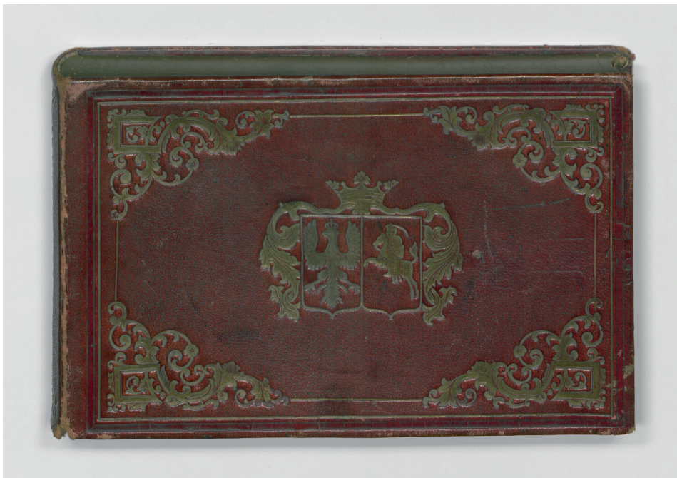
II. 1. Okładka albumu