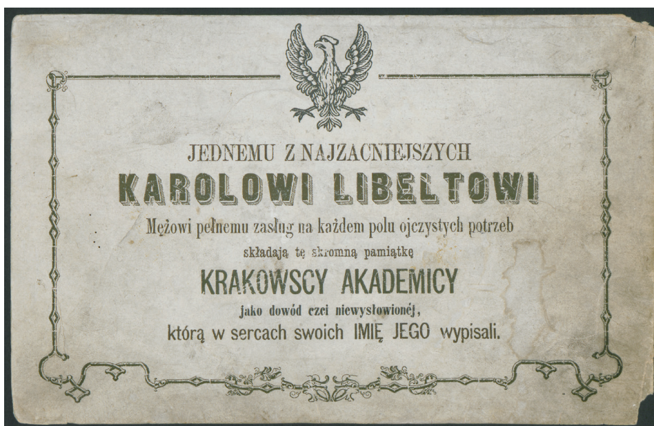
II. 2. Karta tytułowa albumu