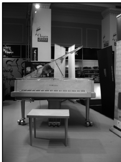
Fot. 2. Salonik Chopinowski – „samogrający” fortepian Yamaha

Szczególnie charakterystycznym miejscem Targów był Salonik Chopinowski – zorganizowany w Sali Marmurowej, w pobliżu stoiska z wydawnictwami muzycznymi. To tutaj odbywały się spotkania z autorami wielu monografii, poświęconych wielkiemu kompozytorowi. Przede wszystkim uwagę zwracał wyeksponowany, cyfrowy fortepian firmy Yamaha, który odtwarzał zapamiętane wcześniej fragmenty utworów Chopina. Widok uruchamianej klawiatury (nie przez pianistę, lecz przez komputer) z pewnością był ciekawym doświadczeniem.