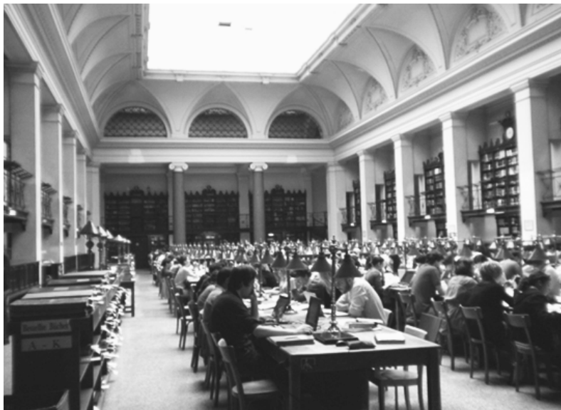
Fot. 4. Wnętrze czytelni Biblioteki Głównej Uniwersytetu Wiedeńskiego

stemu bibliotecznego, składającego się 47 bibliotek wydziałowych oraz biblioteki głównej. Po zapoznaniu się ze zbiorami i systemem funkcjonowania biblioteki wydziałowej, udaliśmy się z krótką wizytą do biblioteki głównej, gdzie mieliśmy przyjemność zwiedzić czytelnię główną.