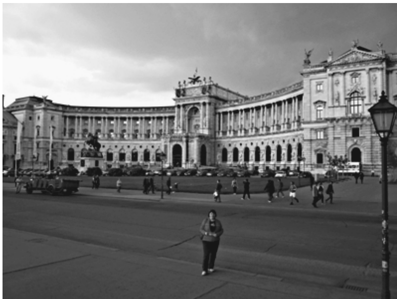
Fot. 5. Gmach Austriackiej Biblioteki Narodowej

W dotychczasowej (pięcioletniej) działalności studyjnej Sekcji Bibliotek Szkół Wyższych SBP przy Zarządzie Okręgu w Katowicach zorganizowaliśmy 6 wyjazdów studyjnych, odwiedzając w sumie 14 bibliotek.