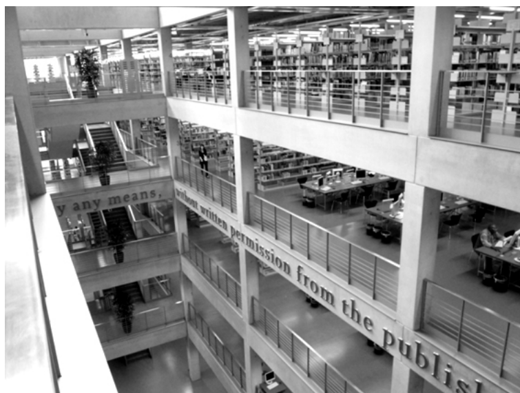
Fot. 2. Universitätsbibliothek der UdK, Berlin

Biblioteki, które odwiedziliśmy były różne. Dzięki temu mogliśmy porównać warsztat pracy bibliotekarzy różnego typu, podpatrzeć nowoczesne rozwiązania technologiczne oraz wymienić doświadczenia (Kalicka, 2008, s. 33).