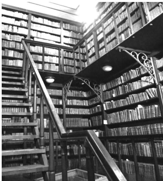
Fot. 3. Zbiory starodruków w Bibliotece Uniwersyteckiej, Budapeszt

Dzięki słonecznej pogodzie i kompetentnej przewodniczce mieliśmy również okazję nacieszyć się pięknem architektury naddunajskiej stolicy (Lembas, 2009, s. 48). W ostatnią z bibliotecznych podróży wybraliśmy się w maju 2010 roku.