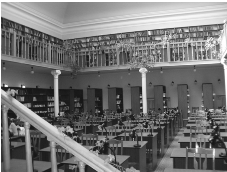
Fot. 1. Czytelnia Biblioteki Stefanyka, Lwów

W kolejną podróż udaliśmy się 7 czerwca 2007 roku, a naszym celem był Lwów. Odwiedziliśmy dwie lwowskie księżnice, Bibliotekę im. Stefanyka, dawną Bibliotekę Ossolińskich oraz Bibliotekę Baworowskich, która jest częścią Biblioteki Stefanyka. Współczesna Biblioteka im. Stefanyka zajmuje kilka budynków. Główny z nich to piękny, o klasycyzujących kształtach gmach, dawny klasztor pokarmeli-