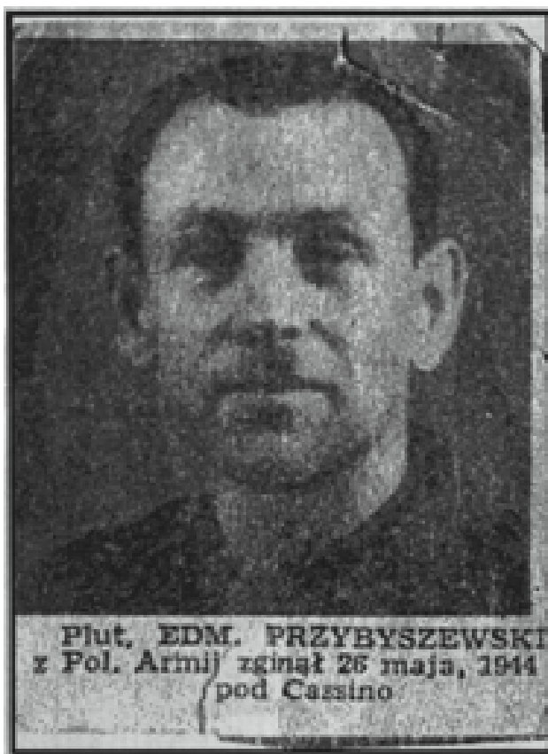
Odbitka fotografii w amerykańskiej prasie z 1944 r. (rep. St. Iłski).