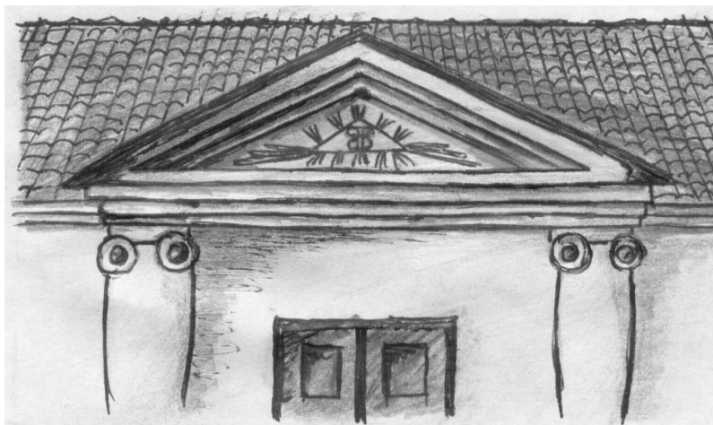
Rys. 4. Trójkątny fronton wejścia głównego

umieszczając właśnie taki symbol, wyraził prośbę do Boga o opiekę i zesłanie harmonijnego ładu na swoje ognisko domowe.