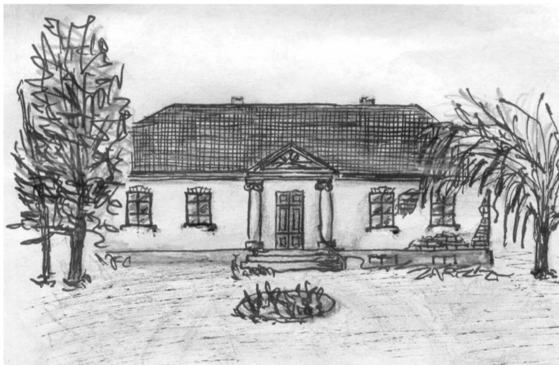
Rys. 2. Dwór w Dziadkowicach (widok części frontowej)

murowane z cegły na zaprawie wapiennej, otynkowane, podpiwniczone, oparte na rzucie prostokąta. Podstawową fizjonomiczną różnicą między dworami ziemi szadkowskiej jest ich wielkość i to ona prowadzi w konsekwencji do dalszego zaost్రzania kontrastu między nimi. Dwory w Prusinowicach i Rzepiszewie są duże, piętrowe, natomiast w Dziadkowicach jest niewielki, parterowy (rys. 2).