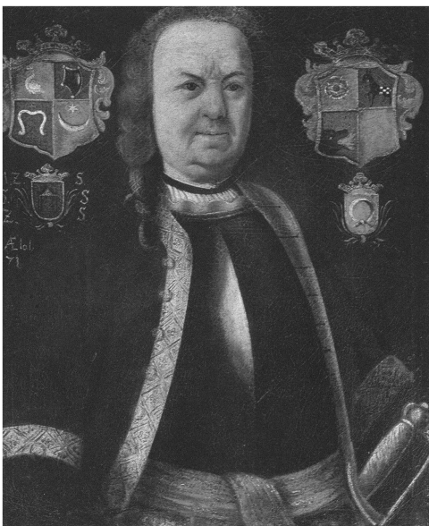
Fot. 1. Franciszek Pstrokoński syn Piotra (obraz nieznanego autorstwa z ok. 1730 r.)

że w Muzeum wiszą portrety dwóch różnych Franciszków Budzisz-Pstrokońskich. Jeden z tych portretów był wizerunkiem starosty szadkowskiego, ale nie tego ze wspomnianej wystawy ani z publikacji Polaków portret własny .