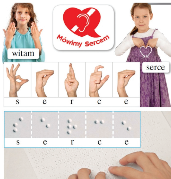
Rys. 1. Język migowy i alfabet Braille'a