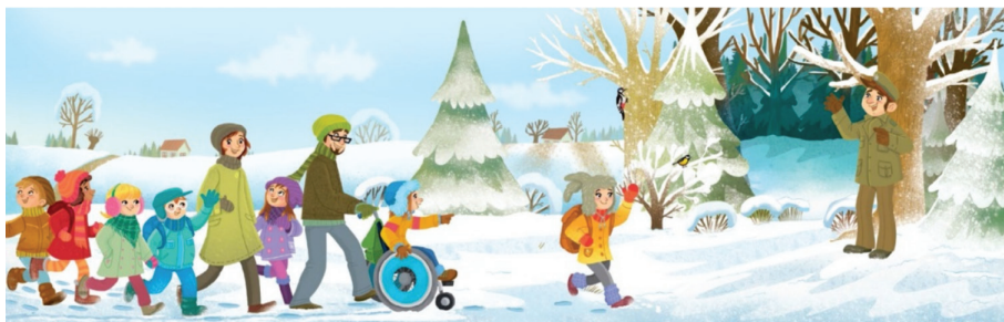
Rys. 4. Wycieczka klasowa

Podjęte w artykule zagadnienia godności osobowej i podnoszenia świadomości społecznej na temat niepełnosprawności możemy interpretować z dwóch różnych perspektyw. Z jednej strony mamy tu do czynienia z sytuacją budowania w uczniach sprawnych postawy wspierającej, pomocowej, empatycznej. Z drugiej strony jednak nie dochodzi do „społecznej wymiany dóbr”. Osoby z niepełnosprawnością są ukazane wyłącznie jako „biorcy” pomocy i wsparcia (rys. 4). Ogląd godnościowy wymaga wskazania na zasoby osób z niepełnosprawnością, zwłaszcza na te aspekty, w których osoby te mogą stać się „dawcami”. To stereotypowe ujęcie relacji: niepełnosprawna mniejszość („biorcy”) – sprawna większość („dawcy”), wydaje się szkodzić idei inkluzji społecznej.