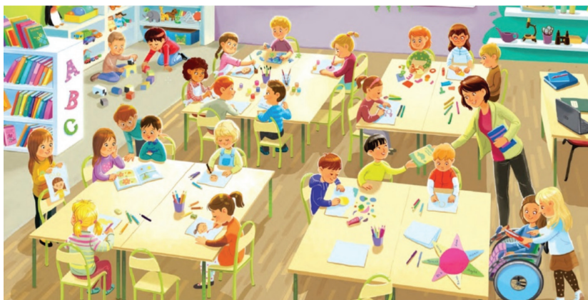
Rys. 3. Przestrzeń klasy, uczniowie, nauczycielka

przez nauczyciela. Uczniowie ci nie wykazują inicjatywy, nie pomagają innym, w przeciwieństwie do uczniów sprawnych, którzy pomagają swym niepełnosprawnym kolegom (rys. 3).