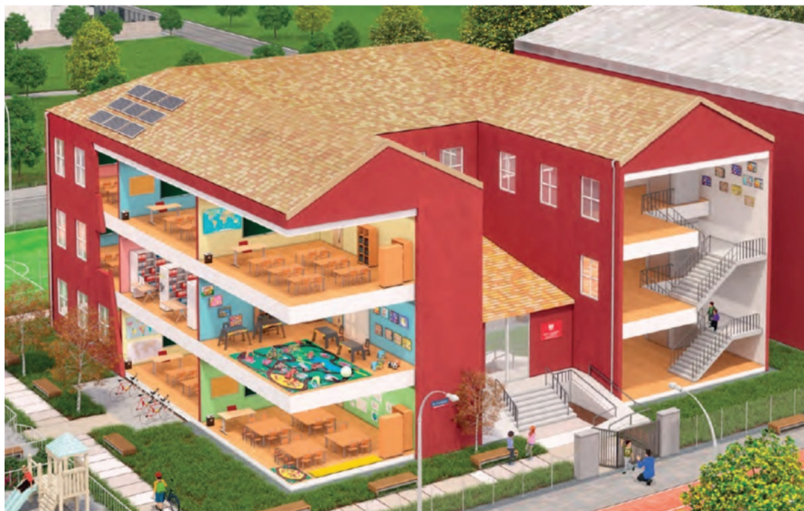
Rys. 5. Budynek szkoły

Pierwszą związaną z przedmiotową problematyką ilustracją, z którą zapoznają się uczniowie, jest budynek szkoły (rys. 5).