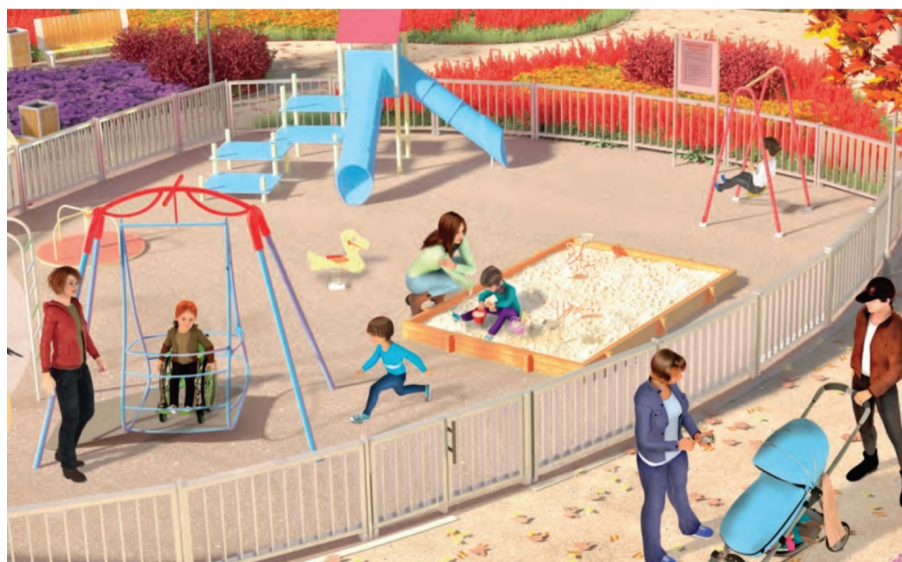
Rys. 6. Plac zabaw