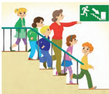
Rys. 7. Droga ewakuacyjna