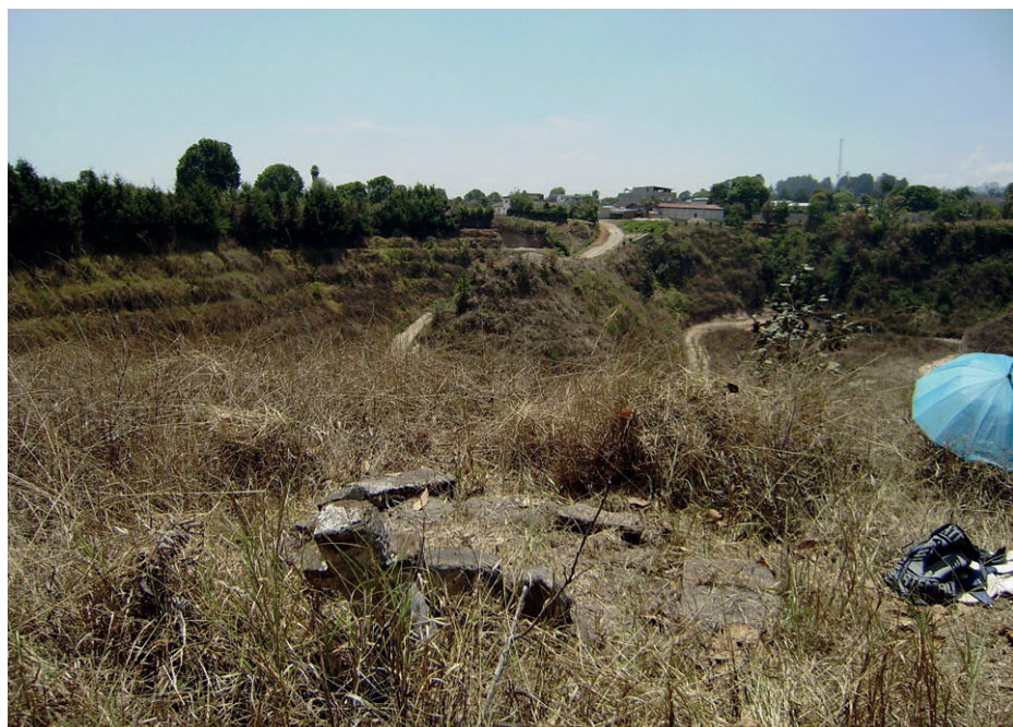
Figura 3. Saqirib'al ubicado en Chichicastenango. Fotografía tomada por Iyaxel Cojtí Ren (2009).