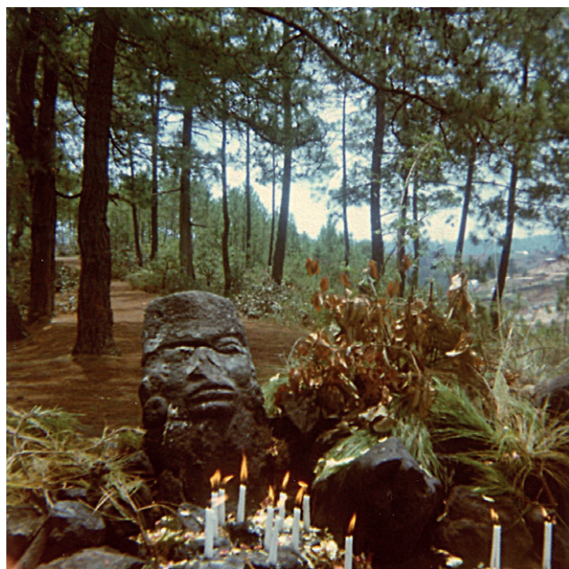
Figura 2. Lugar sagrado de Pacual Ab'aj en Chichicastenango.