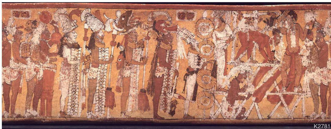
Figura 4. Vasija K2781 (catálogo Kerr, FAMSI).