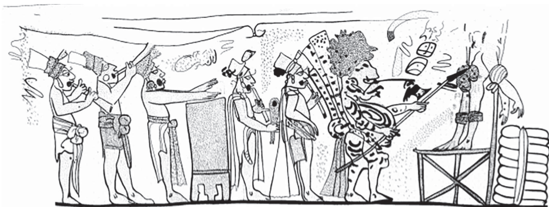
Figura 3. Vasija K206 (catálogo Kerr, after Coe 1973: fig. 33).

Taube (1988: 331) reafirma que el sacrificio por flechamiento tendría que ser común entre los mayas ya en la época clásica, lo que nos testimonian el ya mencionado grafito de Tikal, la vasija K206 (fig. 3) y la Vasija de Cadalso, de la colección de Dumbarton Oaks (K2781, fig. 4). Según Taube, este tipo de sacrificio pudo tener distintas variedades: de un simple atamiento de la víctima a un árbol hasta su atamiento a un cadalso – más o menos complejo. De la misma manera, el arma utilizada para dañar a la víctima pudo variar: un dardo, una flecha o una lanza. Gracias al análisis de diferentes representaciones artísticas Taube (1988: 333-345) diferencia también dos tipos de ritos con los que puede enlazarse el sacrificio por flechamiento, a saber: el rito de la fertilidad y el rito de la ascensión al trono. El primer caso estaría soportado por la escena representada en la ya mencionada vasija de