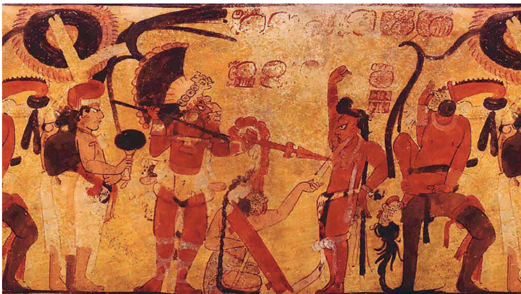
Figura 6. Vasija K2025 (catálogo Kerr, FAMSI).

según la cual los pocos huesos que llevan señas de cocción pudieron ser expuestos a este proceso para facilitar la elaboración de utensilios y no para prepararlos para el consumo. Esta última teoría parece ser soportada por el hecho de que, como dice Tiesler, los huesos recuperados en estos sitios, que llevan señas de exposición al fuego de temperaturas entre 300 y 500 grados, parezcan atestiguar que toda la parte consumible ha sido destruida en este proceso (fig. 7).