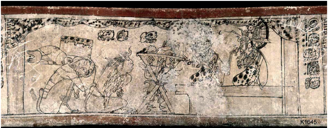
Figura 7. Vasija K 1645 (catálogo Kerr, FAMSI).

Estas dos últimas variantes del sacrificio parecen ser casos particulares. En el caso de la lapidación, la asociación con uno de los pasajes de la Biblia está muy clara (Lev 24, 10-12 y 19). Además, en los siglos anteriores a la Conquista es probable que se emplearan otros tipos de sacrificio con los mismos fines.