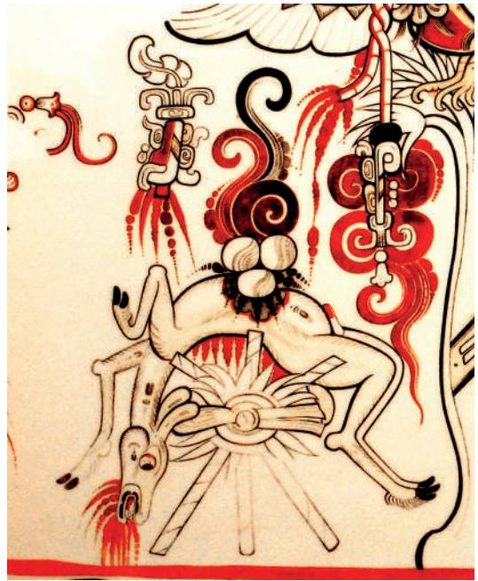
Figura 5. Sacrificio de un venado por extracción del corazón (after Taube et al. 2010: 10, Fig. 58).

Este tipo de sacrificio era típico de los pueblos tzutuhiles, quichés, cakchiqueles y otros grupos que vivían alrededor del volcán Atitlán, en Guatemala; como también de los pueblos de Guaymango y Masaya que vivían en las cercanías del volcán de Pacaya, también en Guatemala (Vásquez 1937-1944: 70). En los dos casos el objetivo del sacrificio era apaciguar al espíritu del volcán para que dejara de echar lava.