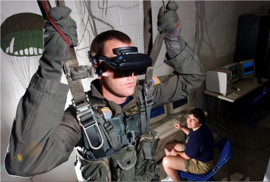
Obrazok 1. Vojak americkej námornej pechoty trénuje let padákom v prostredí virtuálnej reality

v nasledovnom období vývoj nových technických zariadení, ktoré budú sprostredkovať virtuálnu realitu. Z tohto dôvodu je nepresné definovať virtuálnu realitu pomocou zariadení, ktorými je realizovaná.