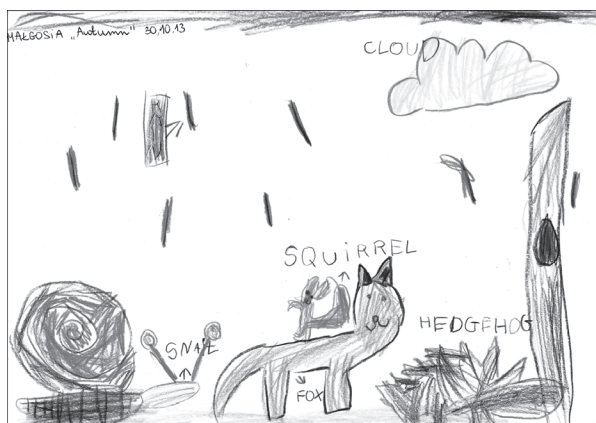
Rys. 1. Małgosia, 6 lat

Nauczyciel wyjaśnia dzieciom, że będą teraz rysować jesień oraz poznane zwierzęta na swoich kartkach. Starsze dzieci wykonują rysunek samodzielnie. Niektóre dzieci podpisują przedstawione na rysunku przedmioty. Nauczyciel pisze na osobnej kartce potrzebne wyrazy, dzieci przepisują. Młodsze odbijają kształt zwierząt przy pomocy foremek, a następnie kolorują. Poniżej załączam niektóre prace dzieci 5- i 6-letnich.