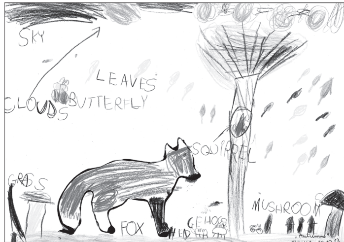
Rys. 4. Emilka, 6 lat