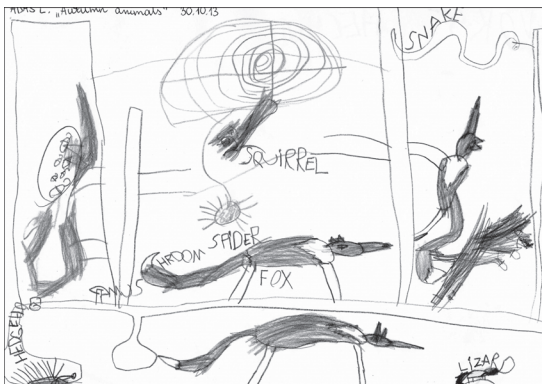
Rys. 5. Adaś, 6 lat