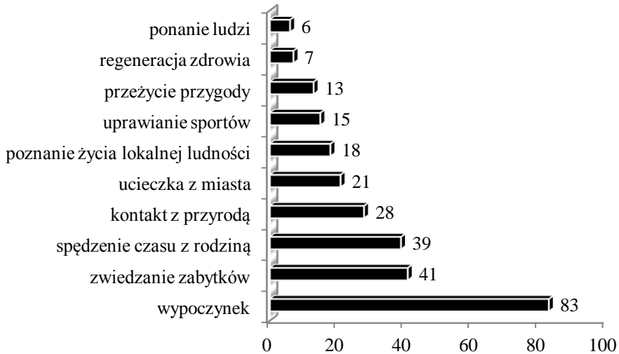
Rys. 1. Główne motywy podróży respondentów (N = 400)

Respondenci mogli wskazać więcej niż jedną odpowiedź.