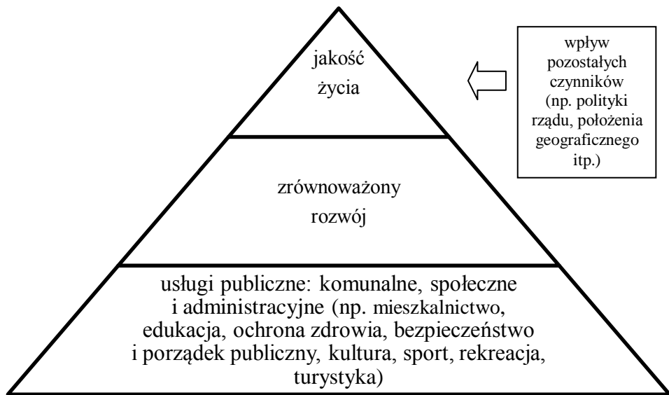
Rys. 3. Relacje pomiędzy jakością życia, zrównoważonym rozwojem i usługami publicznymi

Jakość życia mieszkańców i jej ciągle ulepszanie winny być dla władz samorządowych nadrzędnym celem dla tworzenia koncepcji lokalnego rozwoju w sferze społecznej i gospodarczej oraz dla tworzenia instrumentarium realizacji tych koncepcji. Jakość życia stanowi sedno i cel zrównoważonego rozwoju (rysunek 3) i powinna być rozumiana jako zrównoważone docenianie i dostrzeganie całego bogactwa globalnej jakości i współistnienia w życiu człowieka dobrobytu (cech jakości typu „mieć”) oraz dobrostanu (cech jakości typu „być”) 26 . Samorządy lokalne stoją więc przed ogromnym wyzwaniem w zakresie racjonalnego wykorzystania sił tkwiących w lokalnych zasobach środowiska, kapitale ludzkim i ekonomicznym dla podniesienia obiektywnej (warunki