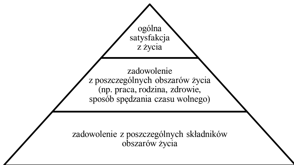
Rys. 1. Hierarchiczny model zadowolenia z życia

W celu wyjaśnienia związków pomiędzy turystyką i rekreacją a jakością życia warto posłużyć się modelem hierarchii satysfakcji (rysunek 1). Podstawowym założeniem modelu jest to, że ogólne zadowolenie z życia jest funkcjonalnie związane z zadowoleniem ze wszystkich jego obszarów, a każdy wyższy poziom satysfakcji jest determinowany przez odczuwanie zadowolenia na poziomach niższych.