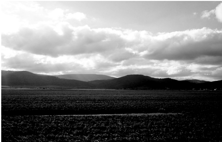
Fot. 1. Widok na Góry Sowie od strony wschodniej

Znaczne zróżnicowanie krajobrazu na obszarze Parku związane jest przede wszystkim z rzeźbą terenu. Granica od strony północno-wschodniej jest wyraźnie widoczna w krajobrazie. Wyłania się nad Kotlinę Dzierżoniowską i Wzgórze Bielawskie wzdłuż sudeckiego uskoku brzeżnego stromymi zboczami o przewyższeniu 400–500 m (fotografia 1), przeciętymi trzema przejezdnymi przełęczami: Walimską, Jugowską i Woliborską. Dzieli one pasmo Gór Sowich na kilka części zbliżonych pod względem rzeźby partii szczytowych ze słabo wyróżniającymi się kulminacjami porozcinanymi głębokimi dolinami potoków.