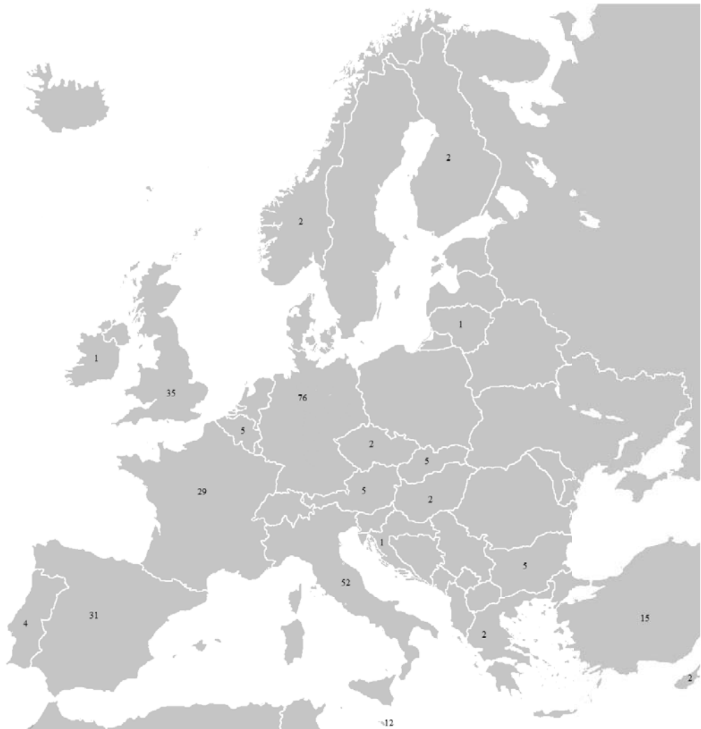
Rysunek 2. Liczba zrealizowanych w latach 2008–2013 projektów mobilności dotyczących kształcenia kadr dla potrzeb obsługi ruchu turystycznego z podziałem na kraje przyjmujące