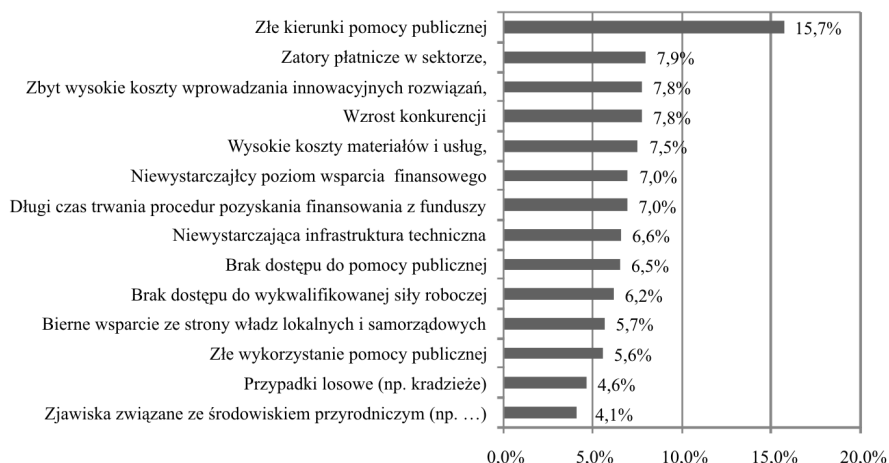
Rys. 2. Przyczyny upadku małych firm funkcjonujących w regionach zmarginalizowanych pochodzące z mikrootoczenia

Analiza otoczenia bliższego wykazała, że najważniejszą potencjalną przyczyną upadku małych firm zlokalizowanych w regionach zmarginalizowanych są złe kierunki pomocy publicznej, co potwierdza fakt, że pomoc publiczna państwa wynikająca z przyjętych planów, w ograniczonym zakresie uwzględnia potrzeby MSP. Pomoc zazwyczaj kierowana jest do dużych przedsiębiorstw, a firmy sektora MSP są pomijane przy podziale środków finansowych na inwestycje i rozwój, w tym przy przydziale środków unijnych. Na kolejnych miejscach respondenci wskazali jako potencjalne przyczyny upadku: zatory płatnicze w sektorze, wzrost konkurencji oraz zbyt wysokie koszty wprowadzenia innowacyjnych rozwiązań (por. rys. 2).