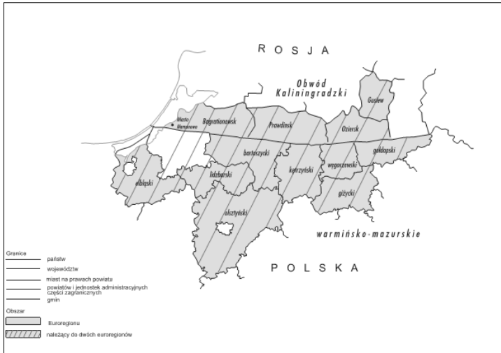
Rys. 3. Mapa Euroregionu Łyna-Ława