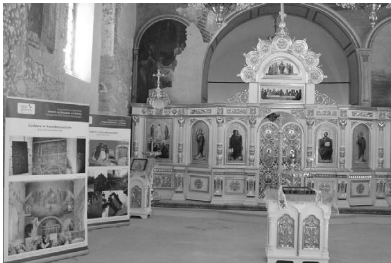
Rys. 5. Cerkiew w Szczebrzesznie po remoncie