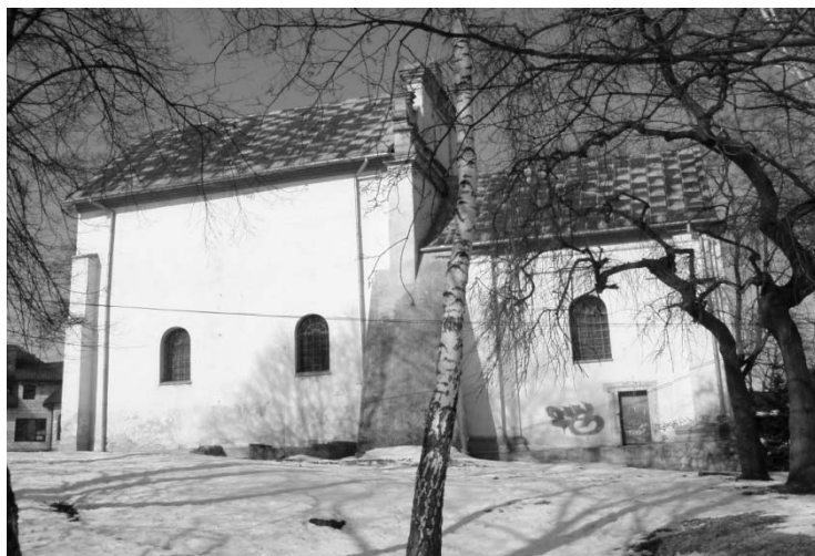
Rys. 3. Cerkiew w Szczebrzeszynie przed remontem