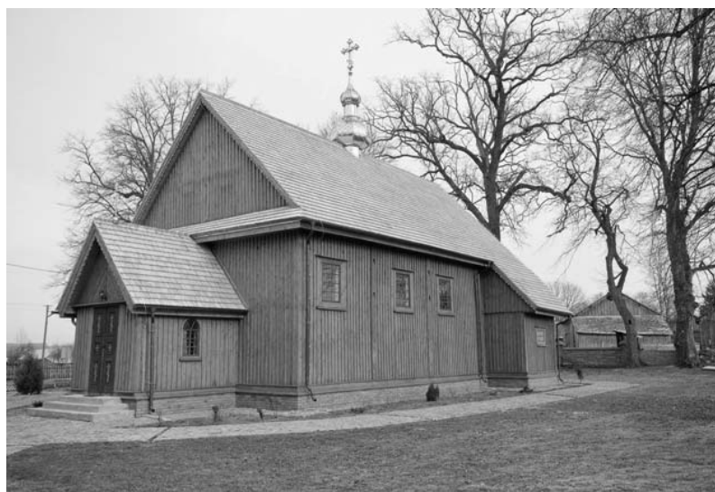
Rys. 7. Cerkiew w Horostycie po remoncie