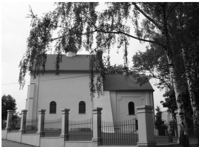
Rys. 4. Cerkiew w Szczebrzesznie po remoncie