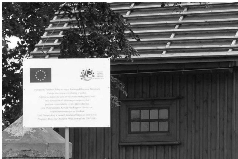
Rys. 6. Remont Cerkwi w Horostycie