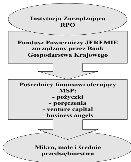
Rys. 2. Schemat działania Inicjatywy JEREMIE w Polsce

Do podmiotów z sektora MSP środki finansowe trafiają poprzez Pośredników Finansowych takich jak: fundusze pożyczkowe, poręczeniowe, banki i inne instytucje finansowe finansujące sektor MSP, np. Spółdzielcze Kasy Oszczędnościowo-Kredytowe. Schemat działania Inicjatywy JEREMIE w Polsce przedstawia rysunek 2.