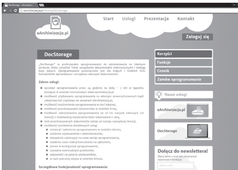
Rys. 4. Podstrona dla oprogramowania DocStorage