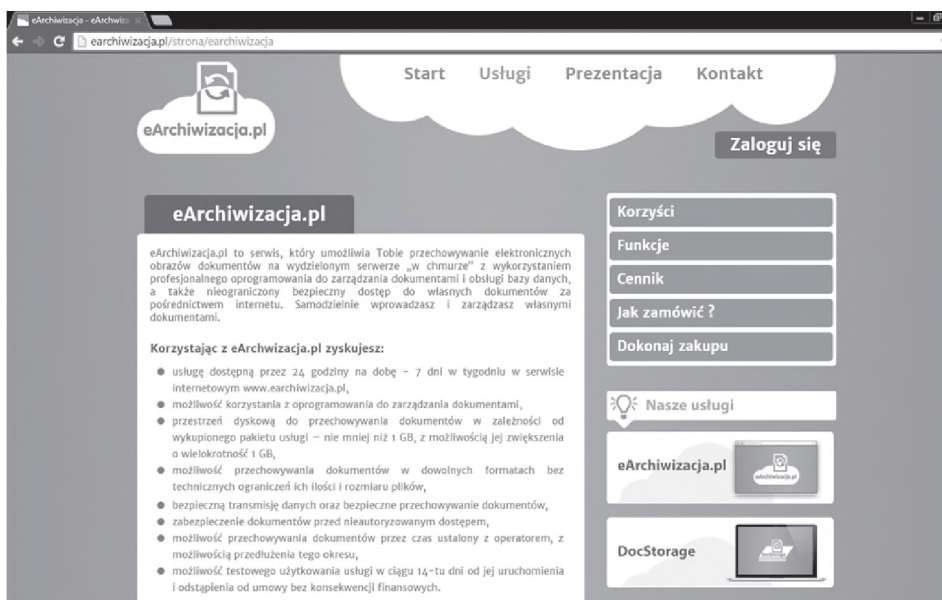
Rys. 3. Podstrona dla usługi eArchiwizacja.pl

Oferuje ona oba sposoby realizacji archiwizacji dokumentów elektronicznych opisane wyżej w punkcie 5, tj. archiwizowanie dokumentów elektronicznych w chmurze eArchiwizacja.pl oraz oprogramowanie do lokalnego archiwizowania DocStorage. Rysunek 3 przedstawia podstronę opisującą funkcjonalność usługi eArchiwizacja.pl.