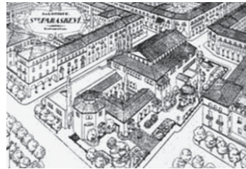
Cerkiew Αγία Παρασκευή w XV w.

odprawił nabożeństwo dziękczynne za odniesione zwycięstwo. Na jednej z kolumn bazyliki zachował się napis po turecku: „sułtan Murat zajął Saloniki w 1430 roku” 20 . W 1487 r. meczet został odrestaurowany pod nadzorem dowódcy tureckiego. Prawdopodobnie wtedy został usunięty drugi stopień dachu z lunetami. Przez cały okres panowania tureckiego cerkiew Αχειροποιήτου była głównym meczetem w mieście. Meczet miał swą nawę: “Εσκι Τζουμά τζαμι tj. meczet piątkowej modlitwy. Może dlatego Grecy określają tę świątynię mianem św. Paraskiewy (Αγία Παρασκευή). Meczet funkcjonował do 1912 r., tj. do wyzwolenia Salonik.