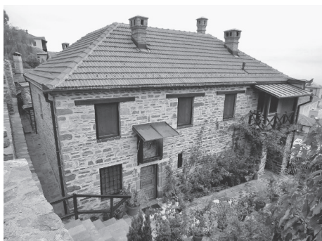
Typikarnica w XIX w. i w chwili obecnej

Karejski Typikon jest jednym z najważniejszych dokumentów w historii religijnej literatury serbskiej. Na 115 wierszach św. Sawa opracował szczegółowe zasady modlitwy, postu i kultu liturgicznego, które miały być realizowane przez mnichów zamieszkujących kielię. Typikon był wzorowany na starożytnych zasadach i modlitwach ascetów, którzy żyli na pustyniach w Egipcie, Synaju i Palestynie. Podczas pobytu św. Sawy Serbskiego w Typikarnicy miejsce to określano jako „słup ortodoksji”. Trwała tu ciągła modlitwa, powstawały nowe pieśni, hymny ku chwale Boga w Trójcy Świętej. Zgodnie z przyjętą regułą w Typikarnicy trwa całodobowa modlitwa za świat, czytany był Psalterz i ewangelie. Święta liturgia sprawowana była jedynie raz w miesiącu. W kielii nikt nie ma władzy: ani protos, ani ihumen, ani inny brat. Obowiązuje tu mil-