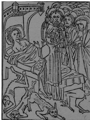
Drzeworyty z dzieła Ars moriendi... z r. 1514

Po zakończonej konserwacji dwa dzieła udostępniono w formie cyfrowej. Są to Ars moriendi ex variis scripturarum sententiis collecta cum figuris ad resistendum in mortis agone diabolicæ suggestioni... 7 i Postilla super Epistolas et Evangelia per totius anni circulum currentia... 8