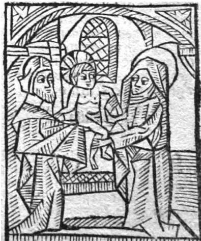
Drzeworyty z dzieła Postilla super Epistolas et Evangelia z r. 1499

Podsumowując miniony rok działalności biblioteki można stwierdzić, że był on niewątpliwie udany uwzględniając przede wszystkim działania o charakterze ochronnym i konserwatorskim. Należy mieć nadzieje, że także w następnych latach uda się podobne prace przeprowadzić. Jeśli ktoś z szanownych czytelników Biuletynu będzie odwiedzał Kraków zapraszamy także w nasze skromne proggi.