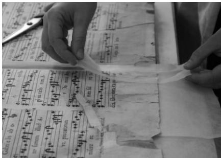
Naprawa karty przy pomocy bibulki japońskiej

Na początku poddano konserwacji pełnej dwa klocki biblioteczne zawierające łącznie 14 woluminów 4 . Obejmowała ona wiele różnych