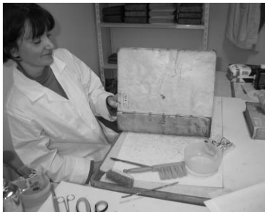
Oprawa książki w trakcie oczyszczania