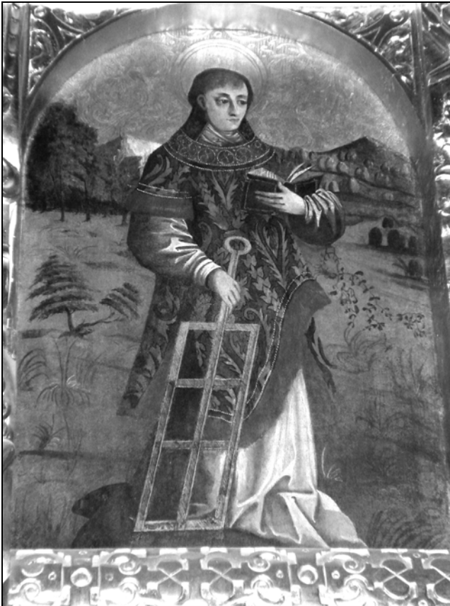
Św. Wawrzyniec, diakon i męczennik

Grób św. Wawrzyńca stał się szybko jednym z najchętniej odwiedzanych w owych czasach. Bohaterska śmierć wyjednała mu w Kościele najwyższy podziw i zapewniła wieczną chwałę.