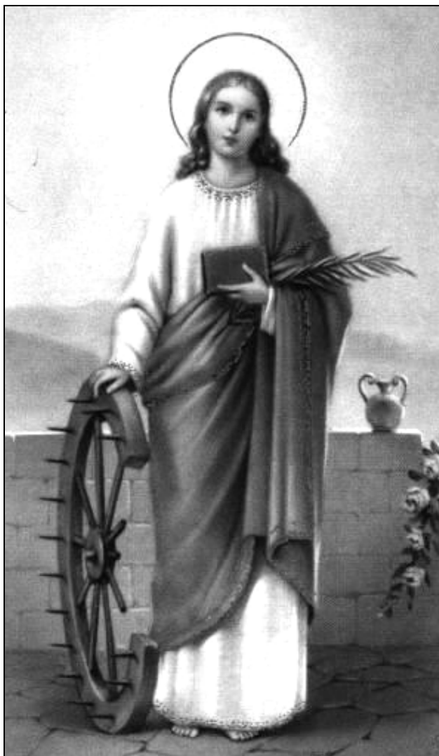
Św. Katarzyna Aleksandryjska, dziewica i męczennica

Ikona najczęściej przedstawia św. Katarzynę Aleksandryjską jako młodą dziewczę niezwykłej urody, w koronie na rozpuszczonych falujących włosach, w bogatej sukni, z księgą w dłoni lub jako męczennicę z atrybutami męczeństwa (koło zębate, miecz). U jej stóp