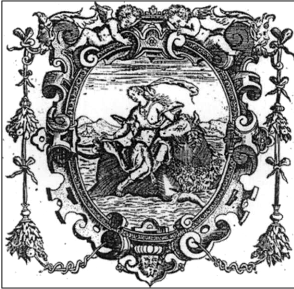
Ryc. 2. Sygnet drukarski oficyny Cierów zamieszczany w kolofonie

w ilustracji książkowej do Metamorfoz Owidiusza wydanych w 1592 i 1606 roku 22 .