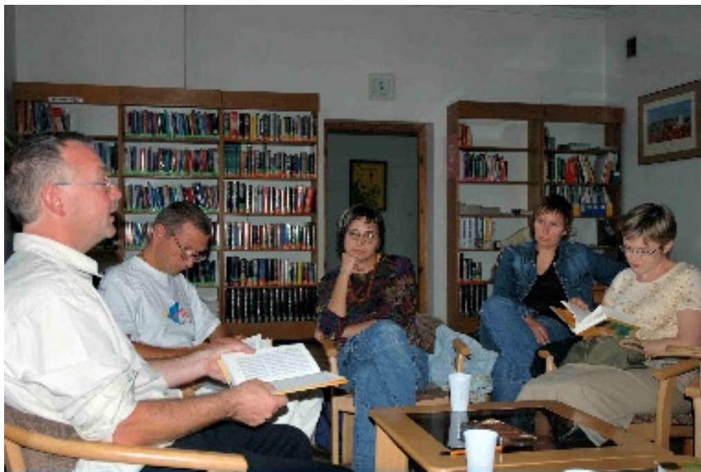
Fot. 2 Dyskusyjny Klub Książki w Bibliotece Brytyjskiej. Łódź 2007

Miesiąca (The Book of the Month Club). 4 W kwietniu 1926 r. drogą pocztową wysłano pierwszą partię książek do 4,750 członków klubu, a już pod koniec tego samego roku ich liczba wzrosła do 46 539. Ponieważ w latach 20-tych XX wieku większość mieszkańców Stanów Zjednoczonych miała utrudniony dostęp do księgarni, sprzedaż wysyłkowa cieszyła się wielkim powodzeniem.