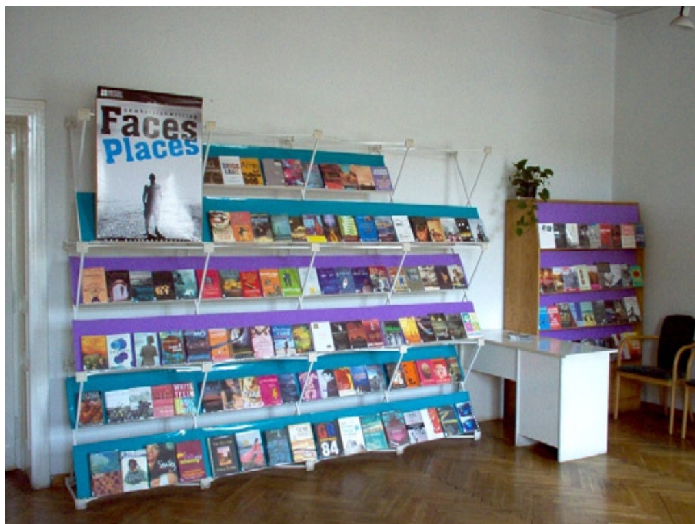
Fot. 1 Wystawa Faces and Places. Łódź 2004

wysłuchania fragmentów powieści, czytanych przez autora oraz zadania pytań twórcy. Polskę odwiedzają zarówno pisarze, których powieści były wcześniej tłumaczone na język polski jak Janette Winterson oraz nieznani dotąd w naszym kraju, jak Toby Litt, czy Nial Griffiths.