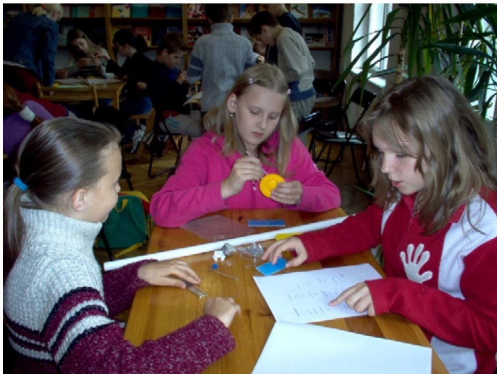
Fot. 3 Warsztaty Climate Change. Łódź 2005

z bibliotek szkolnych. Prelekcjom towarzyszyły warsztaty, podczas których uczestnicy aktywnie wyszukiwali ilustracje w prezentowanych książkach i omawiali ich wpływ na percepcję 9 .