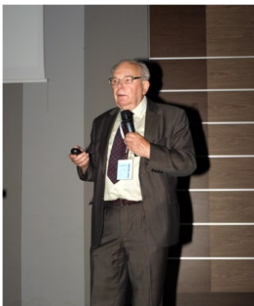
Mgr Bolesław Howorka Poznań - UM