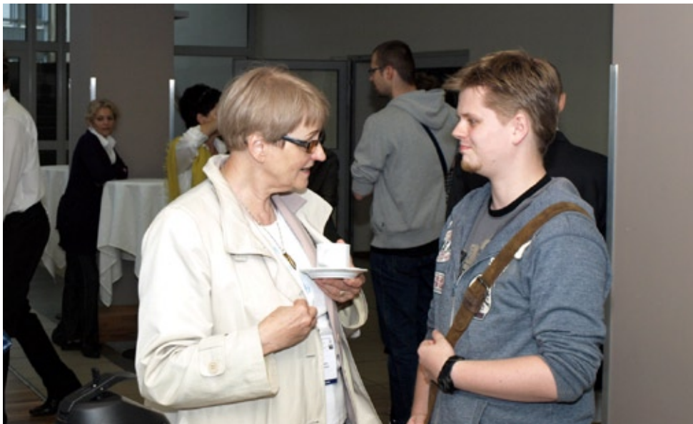
Mgr Józefa de Laval Gdańsk - AM