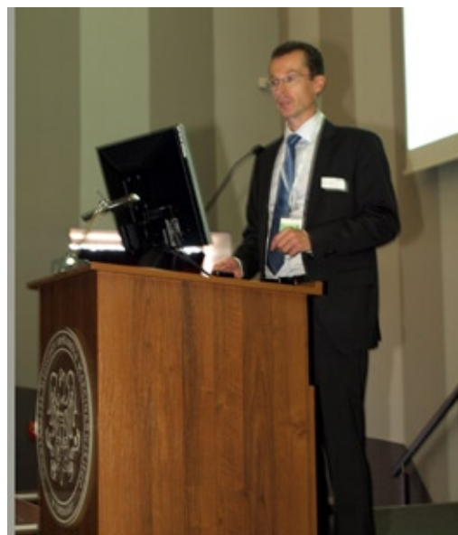
Mgr Uwe Stehle Stuttgart - Thieme