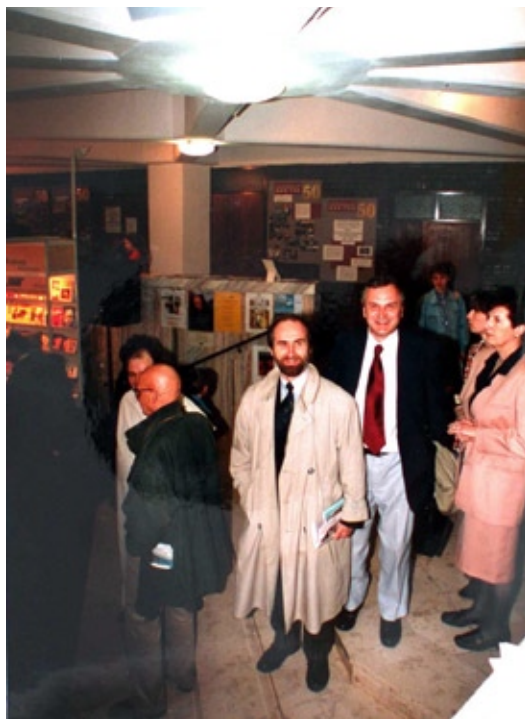
III Targi Wydawców Katolickich, Warszawa – Stegny (1998)

W dalszej perspektywie, związanej z powstaniem nowego gmachu, Biblioteka UKSW pragnie rozwijać się jako centrum edukacji, informacji i kultury, w którym dbałość o chrześcijańskie dziedzictwo kultury europejskiej łączyć się będzie z wykorzystaniem najnowocześniejszych form realizacji przekazu wiedzy i informacji.