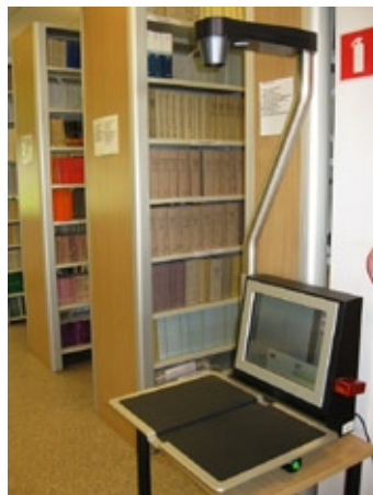
Skaner w Czytelni Główniej