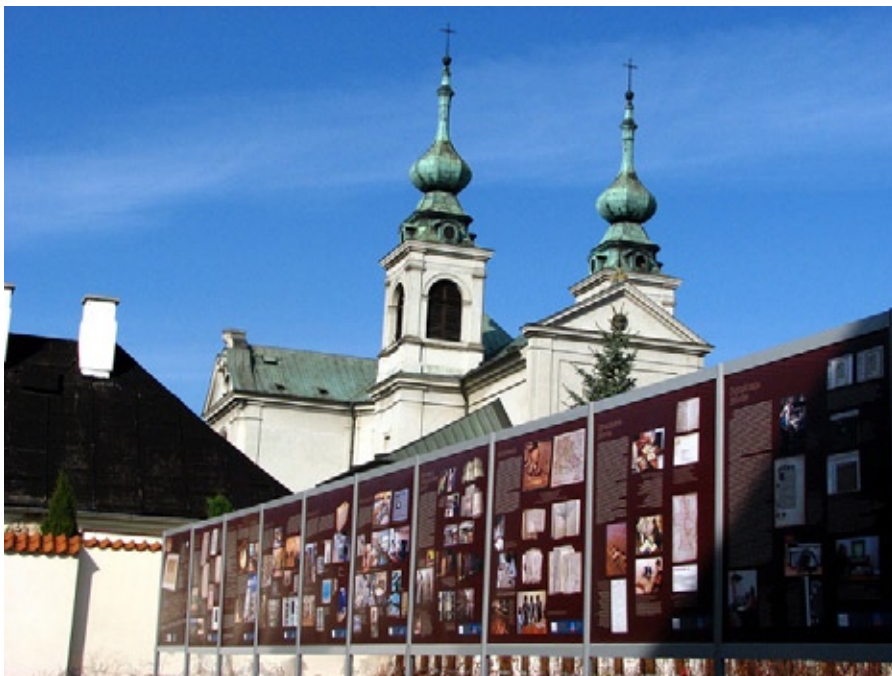
Wystawa pt. Ochrona i konserwacja cieszyńskiego dziedzictwa piśmienniczego