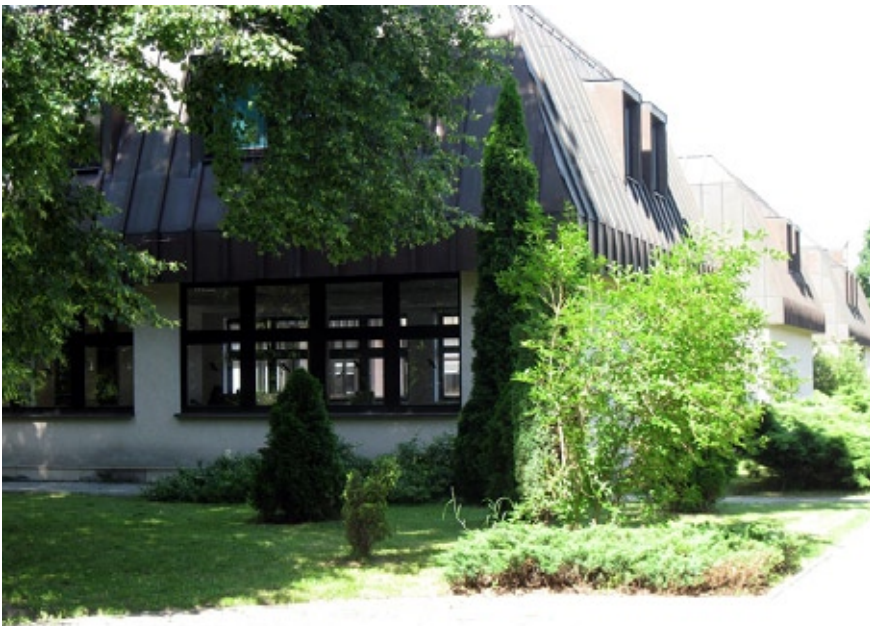
Gmach Biblioteki na Bielanach