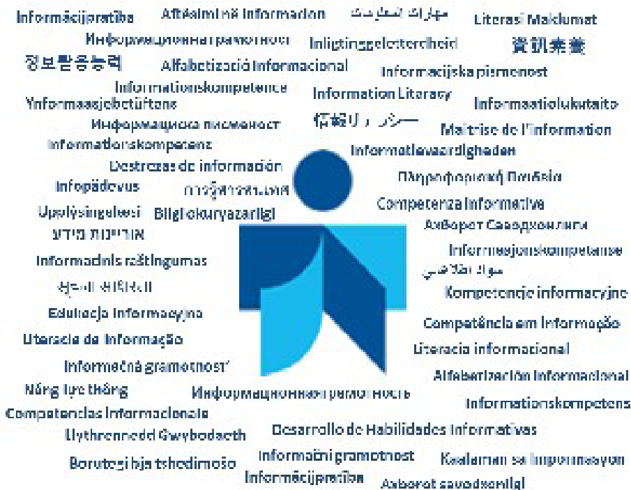
Logo Information Literacy w 21 językach