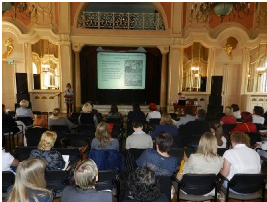
Konferencja „Dziecko w świecie książki i mediów” (2012)