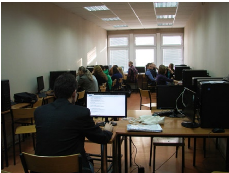
Zajęcia dydaktyczne w nowym laboratorium komputerowym