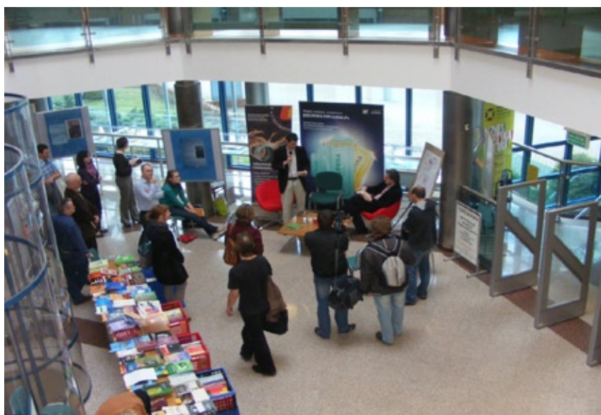
Obchody Światowego Dnia Książki i Praw Autorskich (2012)