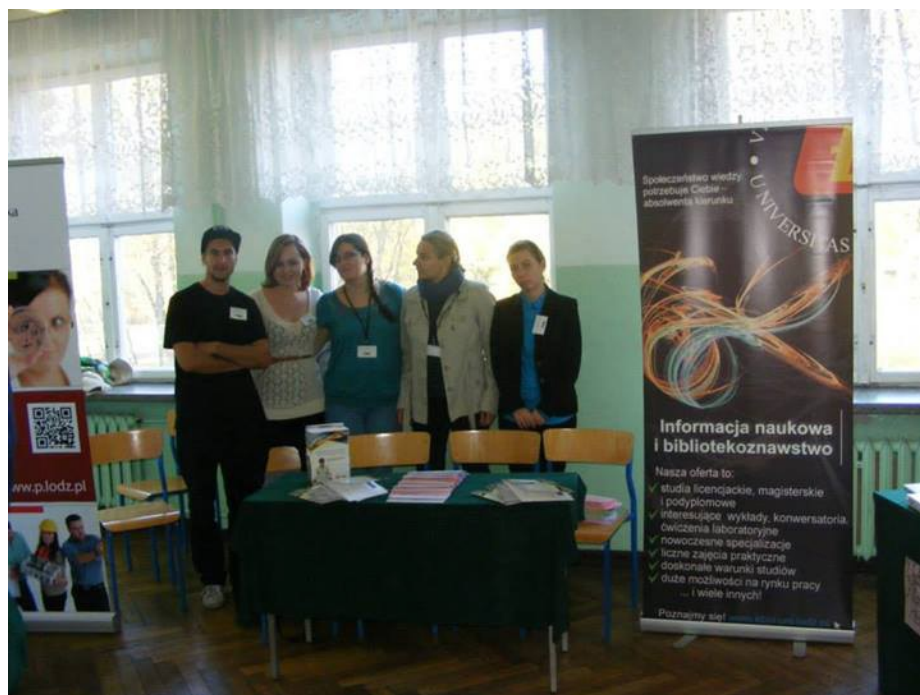
Promocja kierunku w XVIII LO w Łodzi (2013)