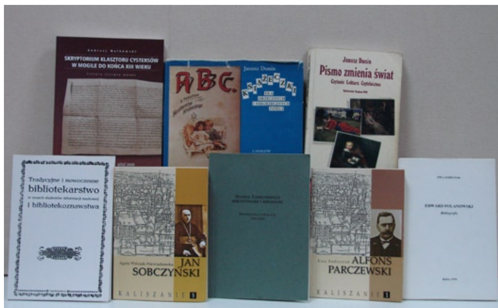
Publikacje autorskie pracowników KBIN