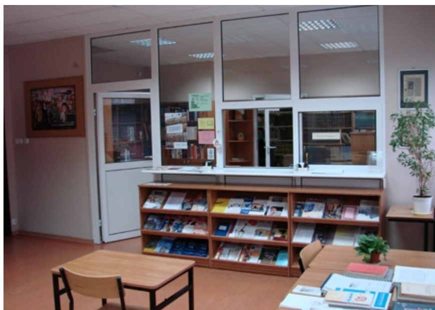
Biblioteka Katedry BiIN - Czytelnia