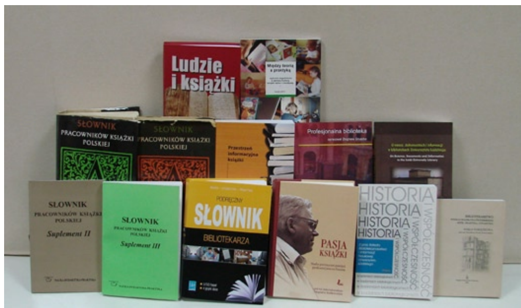
Publikacje zbiorowe pracowników KBIN