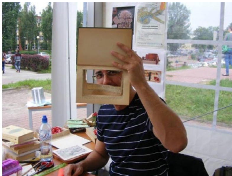
Warsztaty ekologicznej książki (2013)

Przedstawiony obraz łódzkiej Katedry Bibliotekoznawstwa i Informacji Naukowej pozwala z pewnością postawić tezę, iż pomimo zbliżającej się „siedemdziesiątki” jest ona placówką o dużej aktywności naukowej i osiągnięciach dydaktycznych, co jest udziałem byłych, ale przede wszystkim obecnych pracowników. Aktualnie w Katedrze zatrudnionych jest bowiem sześciu profesorów, jedenastu adiunktów i sześć doktoran- tek oraz pracownik administracyjny i bibliotekarka (1/2 etatu).