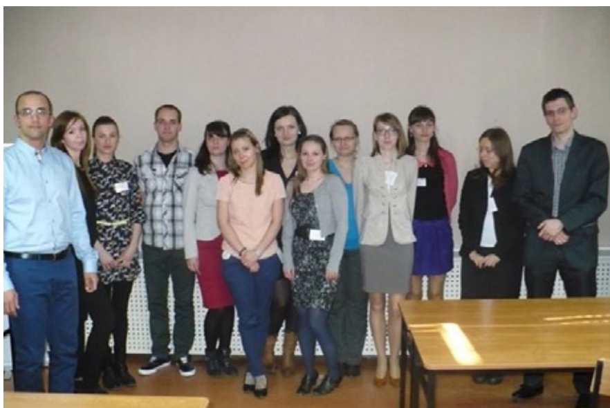
Konferencja Koła Naukowego Bibliotekoznawców (2013)