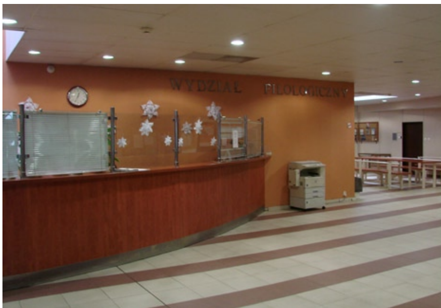
Hall Katedry w budynku przy ul. Matejki 34A