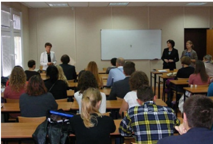
Inauguracja roku akademickiego 2012/2013