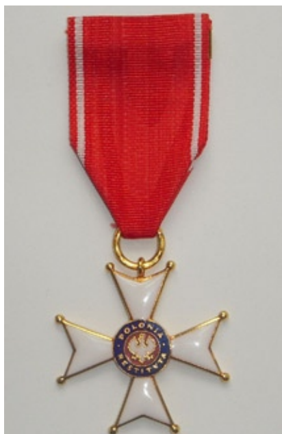
Krzyż Kawalerski Orderu Odrodzenia Polski