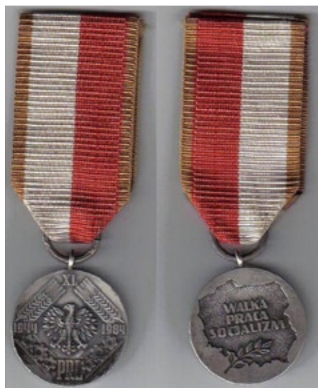
Medal 40-lecia Polski Ludowej