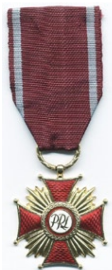
Złoty Krzyż Zasługi