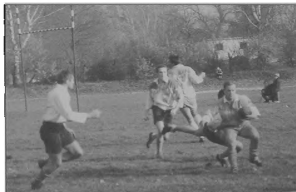
Fot. 8. Szarża / A raid