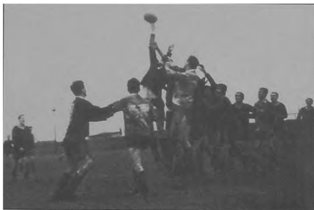
Fot. 2. Piłka w grze... / A ball during play...