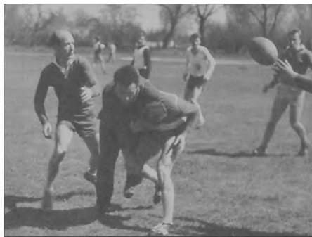
Fot. 5. Walka i piłka / Fighting and a ball...