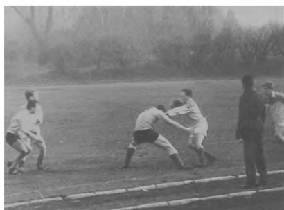
Fot. 6. i 7. Walka o piłkę / Fighting for a ball...