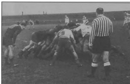
Fot. 3. Młyn / A mill

26 stycznia 1871 roku powołano Związek Football-Rugby, który miał strzec przepisów gry. W tym samym roku odbył się mecz między Anglią a Szkocją w Edynburgu. W 1875 drużyny uniwersyteckie zmniejszyły liczbę zawodników do 15, a nazwę Związku zamieniono na Rugby Union [Radzikowski 2005]. Pierwszy klub rugby poza Wielką Brytanią powstał we Francji w 1881 r. W latach 1886–1890 powstała International Rugby Football Board (IRFB). Od 1987 rozgrywany jest Puchar Świata. 1992 w Bristolu odbył się I Światowy Kongres IRFB. W roku 1995 organizacja ta zrzeszała już 67 członków. Rugby zaistniało jako dyscyplina olimpijska na drugich IO w Paryżu (1900), było w programie czwartych (Londyn 1908), siódmych (Antwerpia 1920) i ósmych (Paryż 1924) Igrzysk Olimpijskich. 24 marca 1934 w Hannowerze powołano Federation Internationale de Rugby Amateur (FIRA) z siedzibą w Paryżu. FIRA zrzesza 54 kraje członkowskie. Od 1971 roku rozgrywany jest Puchar Narodów FIRA. 5 listopada 1994 FIRA przystąpiła do IRFB.