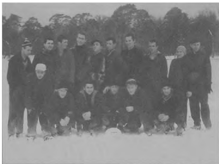
Fot. 4. Trening na śniegu, AZS AWF Warszawa / Training on the snow in Warsaw

Oprócz sportów wojskowych, zwanych też obronnymi, i sportów walki warto wyróżnić jeszcze sporty uzupełniające do tychże. Na przykład ringo jest grą zręcznościową przydatną zwłaszcza w szermierce [Cynarski 2002–2003], natomiast uproszczone sumō i uproszczone rugby są od dawna dość powszechnie wykorzystywane w licznych sekcjach jūjutsu i jūdō .