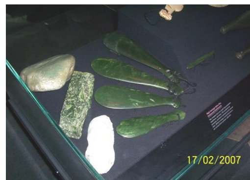
Fot./Photo 4. MERE POUNAMU

W walce Patu i Mere było wykorzystywane jako broń ofensywna i używano jej głównie do atakowania głowy przeciwnika oraz jego witalnych punktów. Podstawowe uderzenie przewidywało poziomy atak wymierzony w okolice skroni. Stosowane było także uderzenie pod żebra, zadawane od dołu ku górze. W czasie użytkowania broń była ciasno owinięta wokół nadgarstka sznurkiem, połączonym z PATU w specjalnie nawierconym otworze [Taonga Tuku Iho 2002].