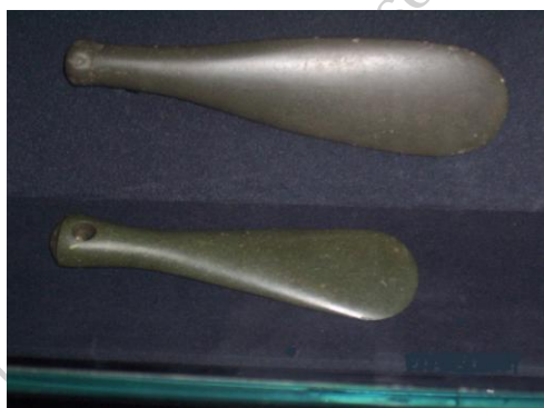
Fot./Photo 3. MERE POUNAMU

MERE POUNAMU była prawdopodobnie najbardziej szanowaną bronią Maorysów. Wpływ na to miał wysiłek wkładany w wytworzenie takiej broni, a także niedostępność POUNAMU (zielony kamień-jadeit) w większości rejonów Aotearoa. Mere Pounamu wykonywane było ze szlifowanego jadeitu o rozmiarach wahających się od 24 do 43 cm długości. Pierwszym krokiem wykonania Mere było wycięcie odpowiedniego bloku ze skały, następnie formowano jego kształt przy pomocy specjalnych młotków, a po uzyskaniu odpowiedniego kształtu całość szlifowano w wyżłobionych skałach. Skała, z której powstawało Mere, jest niezwykle twarda, dlatego obróbka wymagała wiele cierpliwości. Ze względu na ogromny wysiłek wkładany w wytwarzanie miecz, broń ta była bardzo cenna, przekazywana z pokolenia na pokolenie, często nadawano jej imiona, a także składano do grobu razem z wojownikiem.