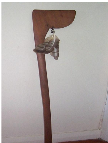
Fot./Photo 9. TEWHATEWHA

TERERAREA jedna z najmniejbezpieczniejszych drewnianych włóczni o długości około 3 metrów z ostrzem, które posiadało dodatkowe kolce, skonstruowane tak, aby łamało się w ciele ugodzonego przeciwnika.