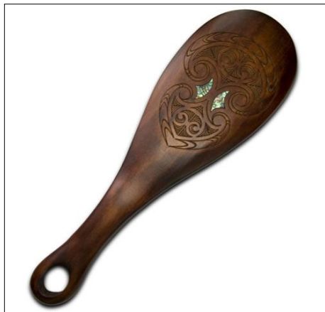
Fot./Photo 1. PATU