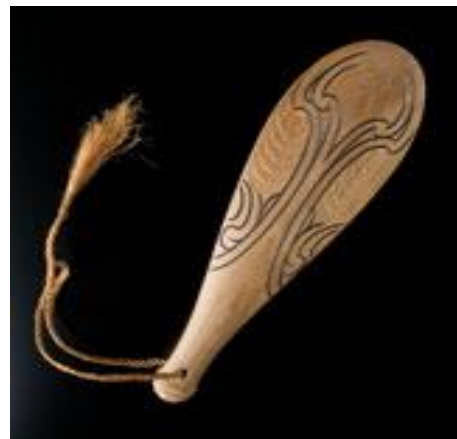
Fot./Photo 2. PATU

Pośród PATU i MERE można wyróżnić PATU PARAOA, która była robiona zwykle z kości kaszalota i była wyjątkowo wytrzymałą i dobrze wyważoną bronią. Symetryczna w swej formie była prostą bronią o płaskim ostrzu, z których każdy egzemplarz różnił się rozmiarem i kształtem. Większość Patu Paraoa miała średnią długość 43 cm i grubość 1,5–2 cm w najgrubszym punkcie. Można przyjąć, że Patu powstawały z kości ciemieniowej kaszalota.