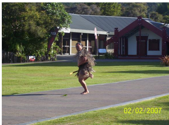
Fot./Photo 11. Maoryski wojownik / Maori warrior