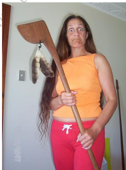
Fot. 10. Maoryska z TEWHATEWHA / Photo10. Maori woman with TEWHATEWHA

Ostatni rodzaj włóczni to TIMATA – zwana też TORO o średniej długości, służyła zarówno do rzucania jak i do walki ręcznej z ostrym zakończeniem.