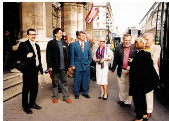
Fot. 1. Grupa Polaków obok Opery Narodowej. Konferencja w Wiedniu, 2002 / Photo 1. Group of Poles next to National Opera. Vienna Conference 2002