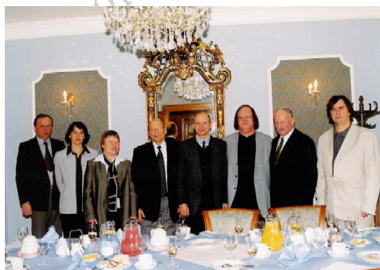
Fot. 2. Spotkanie z Tadeuszem Ferencem – prezydentem Rzeszowa / Photo 2. Meeting with the president of Rzeszów, T. Ferenc

Socjologia sportu, będąca subdyscypliną socjologii kultury, w ostatnich latach rozwija się bardzo dynamicznie. W Polsce prym wiedzie tutaj Katedra Nauk Społecznych AWF w Warszawie, z którą blisko współpracuje rzeszowski Wydział Wychowania Fizycznego UR. Efektem działań zrzeszonych w EASS socjologów, a także filozofów i pedagogów kultury fizycznej, była zorganizowana w Rzeszowie i Łańcucie druga międzynarodowa konferencja tego stowarzyszenia. Konferencję poprzedziło kilka spotkań, konsultacji i sympozjów z władzami EASS [Cynarski 2003a, b, 2004] (fot. 2, 3).