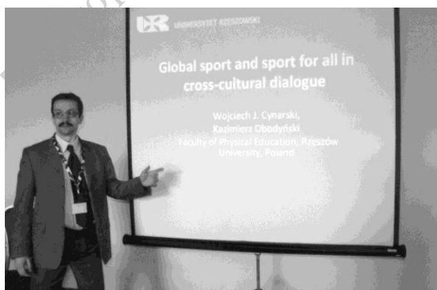
Fot. 10. Podczas sesji referatowej / Photo 10. During a session

Prof. Mojca Doupona Topič, główna organizatorka tej konferencji, zadbała nie tylko o wysoki poziom zakwalifikowanych do prezentacji prac, ale też o kulturalną oprawę tego naukowego wydarzenia (fot. 11). Podczas ceremonii rozpoczęcia i zakończenia konferencji oraz na zamku w Ljublanie uczestnicy mogli podziwiać występy taneczne, baletowe i muzyczne na najwyższym poziomie. Ponadto sam dobór miejsca z widokiem na bajkowe jezioro, ze średnio-