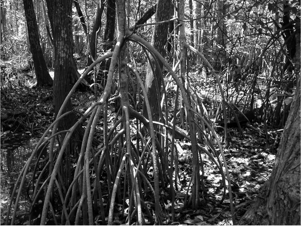
Fig. 3 Vista de lo intrincado que son los manglares. Xicalanco, Campeche, México.

El Tulijá llegaba hasta Salto de Agua, donde terminaba esta ruta por agua. “De aquí la peregrinación se va a pie a Tila” (Vargas y Ochoa 1982: 66). Sin embargo, a pesar de lo largo del trayecto, en la primera mitad del siglo XX Frans Blom y Oliver La Farge (1925-26) remontaron este río durante cinco días, después de Salto de Agua. Este conocimiento de las rutas acuáticas se ha perdido con el paso del tiempo y actualmente no existen más que recuerdos de ellas. Al respecto, decía un informante: “[...] mi papá ya no puede ir y yo no conozco los pasos ni los cambios de marea, por eso no me atrevo a ir [...]” (Vargas y Ochoa 1982: 66).