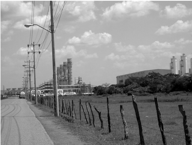
Fig. 1 Vista de la planta de nitrógeno localizada en la Península de Xicalanco, Campeche, México.

Los promedios anuales de lluvia son mayores a los 1500 mm; las temperaturas medias alcanzan los 26°C, con meses tan tórridos que sobrepasan los 40°C. A estas condiciones climáticas hay que agregar que las elevaciones no rebasan los 100 msnm. Asimismo, la poca permeabilidad de los suelos junto con la avanzada deforestación y el alto índice de precipitación provocan que, anualmente, en el verano, ocurran grandes inundaciones. Sin embargo, la visión popular de los habitantes del área es que la actualidad el agua misma ha cambiado en su contenido e impactos: “[...] llega muy fea. No más les cae a las plantas y como que se queman [...]”. Estos cambios son atribuidos a los desarrollos industriales y a Petróleos Mexicanos (PEMEX). De hecho, además de esta industria paraestatal, la instalación de una gasera y la recién abierta planta de nitrógeno, ambas en la entrada de la Península de Xicalanco (Fig. 1), junto con la avanzada deforestación, han modificado