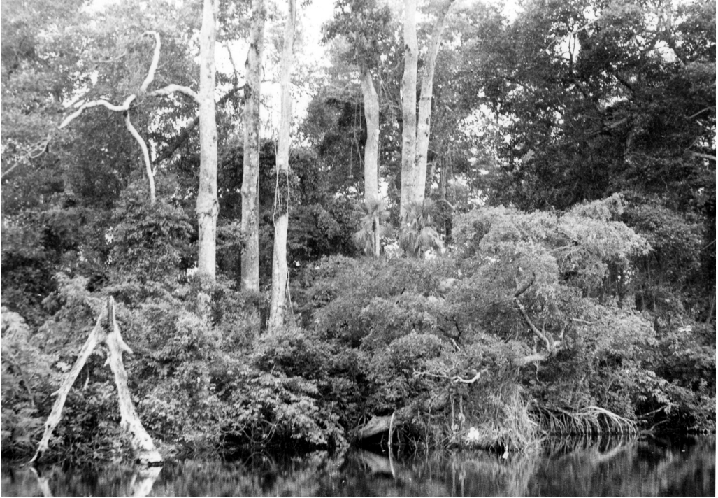
Fig. 2 Detalle de humedales de Xicalanco y la diversidad vegetal que albergan.

el paisaje regional de manera drástica, eliminando los árboles con más de 30 metros de altura, que la caracterizaban hasta la década de los 70 (Fig. 2).