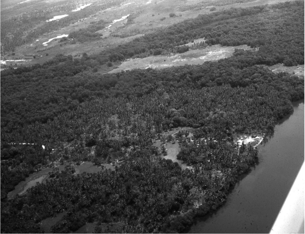
Fig. 6 Vista aérea del enclave de Sta. Rita, identificado con el puerto prehispánico de Xicalanco (1978).

Rico (Fig. 6), localizamos un sitio que se encuentra rodeado de terrenos bajos, sobre unas lomas de suave pendiente sembradas de cocoteros, cuya sombra cobija verdaderas nubes de mosquitos, que apenas permiten abrir la boca sin tragarse uno que otro. Cuánta razón le asiste a fray Tomás de la Torre (1945: 153), cuando escribe que Xicalanco “[...] tiene muchos mosquitos de los zancudos; y así nos aprovechó mucho traer aquellos pabellones [...]”.