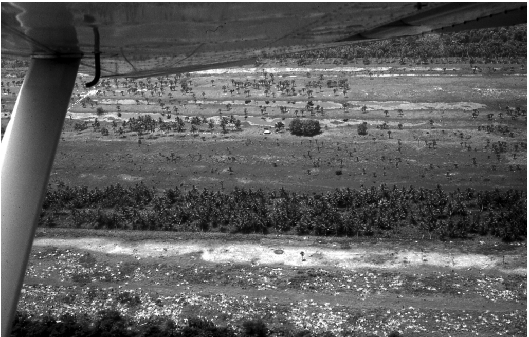
Fig. 4 Vista aérea de los camellones sembrados con cocoteros. Xicalanco, Campeche, México (1978).

Aquí se puede anotar que aún cuando casi toda la península está formada por riberas bajas, ocupadas por manglares, pantanos y vegetación de monte bajo, destaca la presencia de los “camellones”, una especie de terraplenes, conocidos localmente como “jilones”, que quizás en tiempos antiguos, como ahora, se aprovecharon para practicar la agricultura; especialmente los de origen natural: fluvial o eólico, pero no los que tienen concha de ostión y tierra apisonada (Fig. 4). Por lo cual no se descarta que algunos de esos “camellones” naturales se hubieran modificado con distintos propósitos. En estos se encuentra la escasa tierra que puede cultivarse en la región, toda vez que prácti-