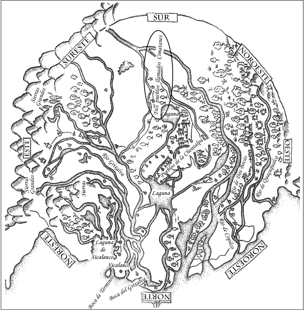
Mapa 2 Ubicación de los tres Cimatanes. Redibujado de Scholes y Roys (1968: 16-17) por César Fernández. Reproducido con permiso.

Como el mismo Ruz reconoce, y a la luz de las referencias con que se cuenta, no es posible sostener que los zoques fueran tributarios de los nahuas asentados en lo que se llamó “los tres Cimatanes”.