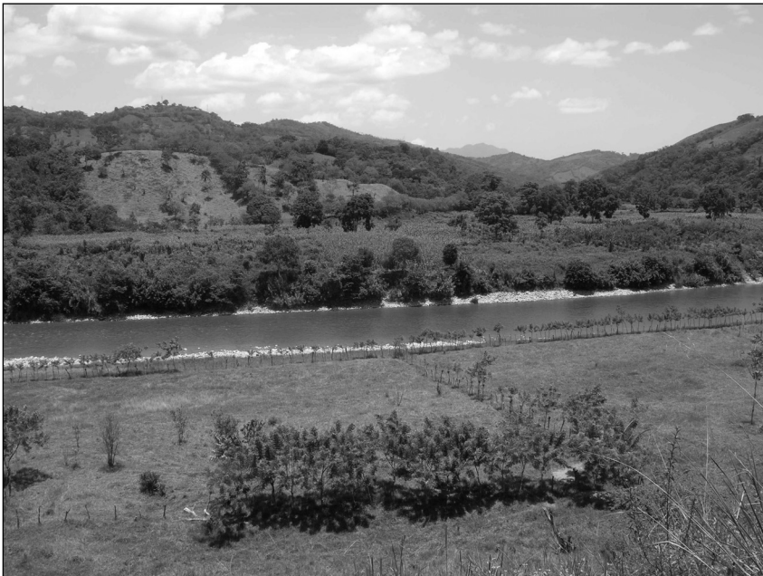
Fig. 1 Cultivo de maíz en la margen izquierda del río Oxolotán, municipio de Tacotalpa, Tabasco.