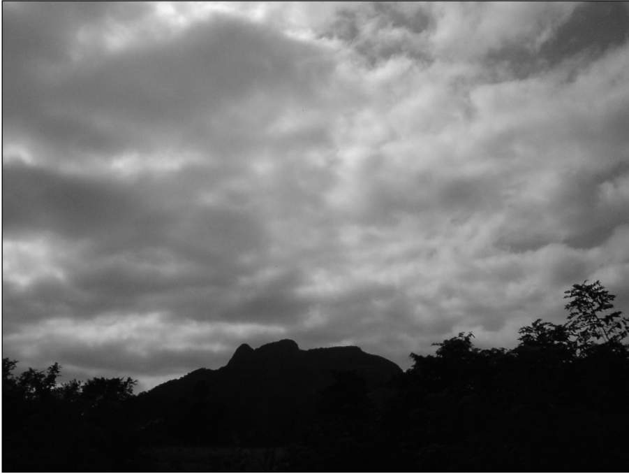
Fig. 7 Vista de uno de los cerros desde Tancoco, Veracruz, en la Sierra de Otontepec.

El relámpago es a la vez, anuncio de tormenta y amenaza potencial capaz de incendiar un pueblo entero 16 . Y desde Tancoco a los cerros de la Sierra de Otontepec se les considera como contenedores de volcanes además de estar asociados a Mushilam , pues los volcanes están conectados subterráneamente al mar.