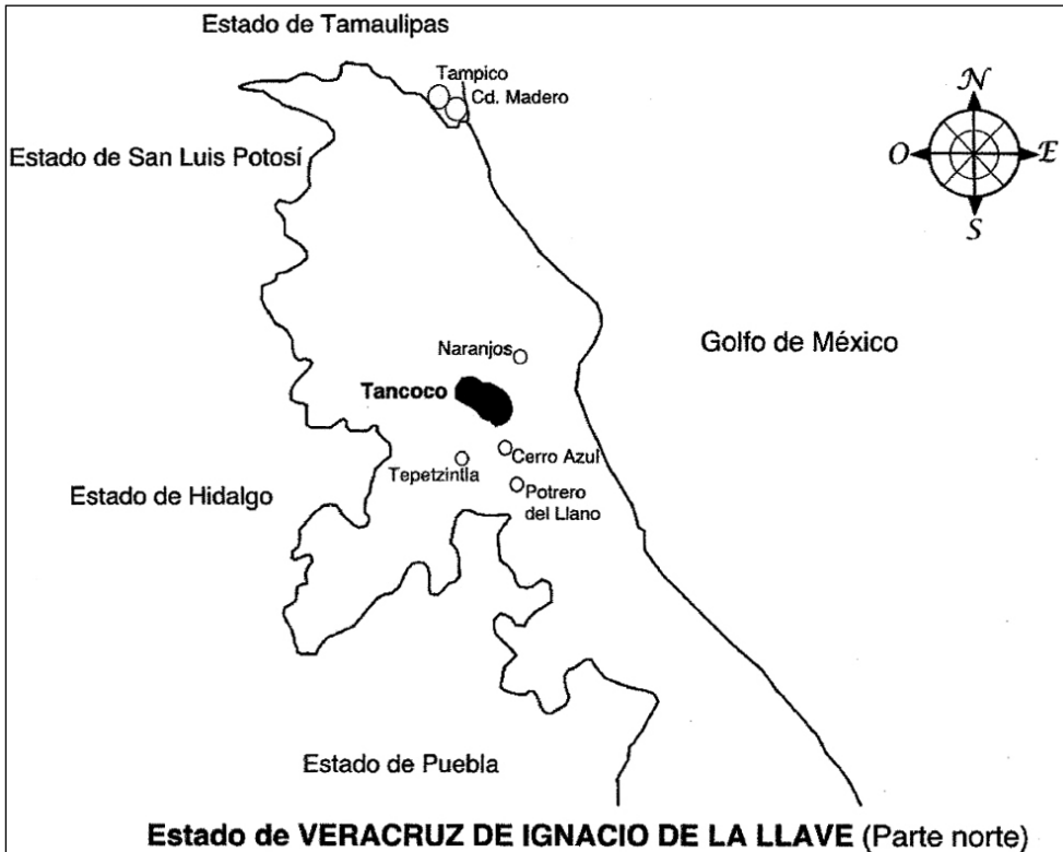
Mapa 1 Parte norte del estado de Veracruz. Dibujado por Arturo Castillo. Reproducido con permiso.

el estado de Tamaulipas, el Distrito Federal o hacia otros destinos. La siembra del maíz, así como la siembra de otras plantas y el mantenimiento de una milpa, continúan siendo marcadores importantes en términos rituales, así como un sustento para las unidades domésticas 3 (Mapa 1).