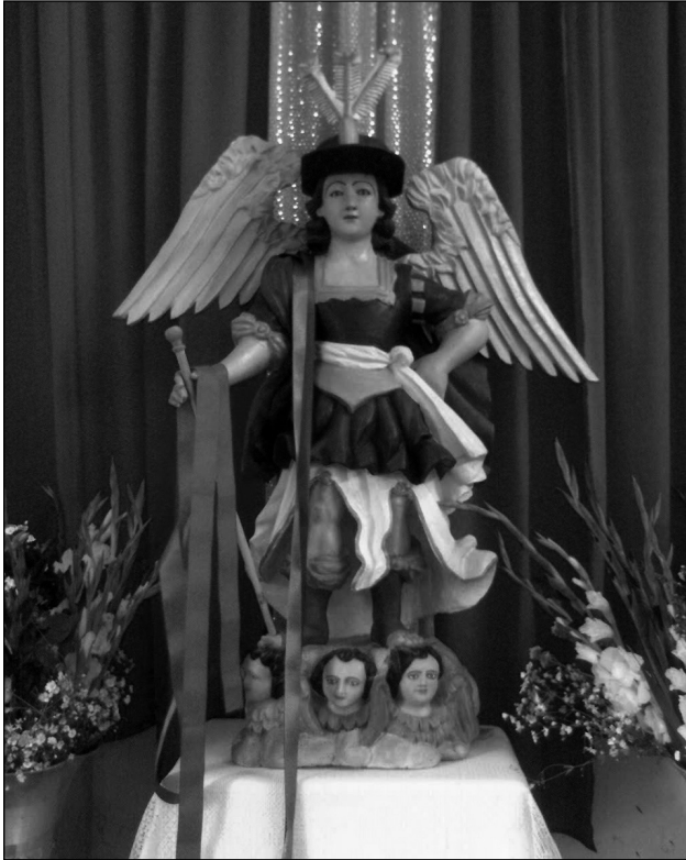
Fig. 6 San Miguel Arcángel en Tancoco, Veracruz.

Pero no olvidemos que también es el tiempo de la primera ofrenda, lo que se considera el inicio de un ciclo festivo asociado con los muertos y la fecundidad de la tierra, y en Tancoco se enfatiza el elemento acuático asociado con San Miguel Arcángel. Según Alegre (2007: 145), este día “se abren las puer-