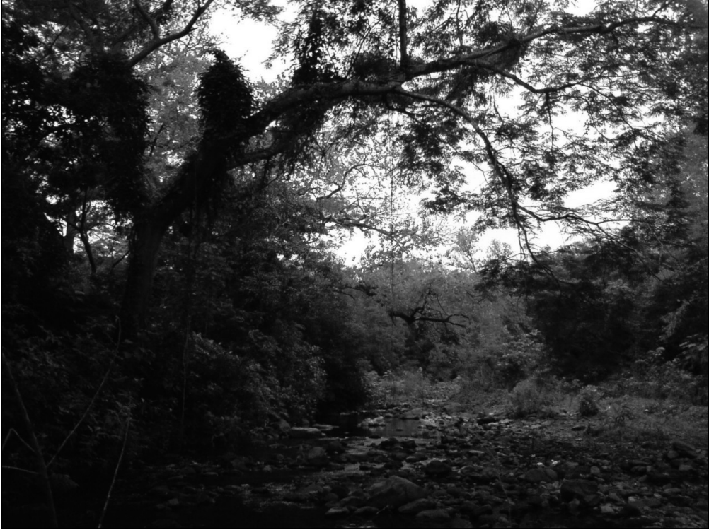
Fig. 1 El agua que cae de los cerros forma sus caminos en Tancoco, Veracruz.