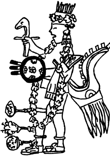
Fig. 1 El representante de Huitzilopochtli vestido en guirnalda de flores o del maíz tostado durante la veintena Tlaxochimaco . Códice Florentino (facs. II: f. 60v). Redibujado por Agnieszka Brylak.

Es notable que al igual que en los casos analizados con anterioridad, también durante la veintena Toxcatl la presencia de la comida en forma de decorado iba acompañada de un baile común. Primero, los sacerdotes, con una soga gruesa de maíz tostado (llamada toxcatl ) en las manos, rodeaban