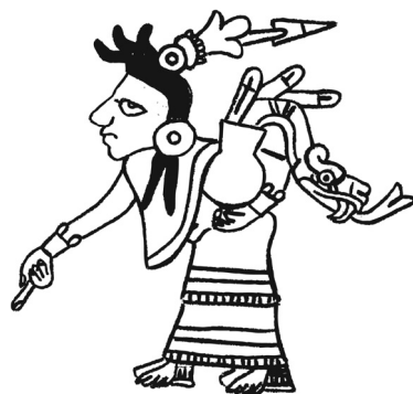
Fig. 4 Representación de la flor como el adorno de cabeza. Códice Fejérváry-Mayer (lám. 27). Redibujado por Agnieszka Brylak.