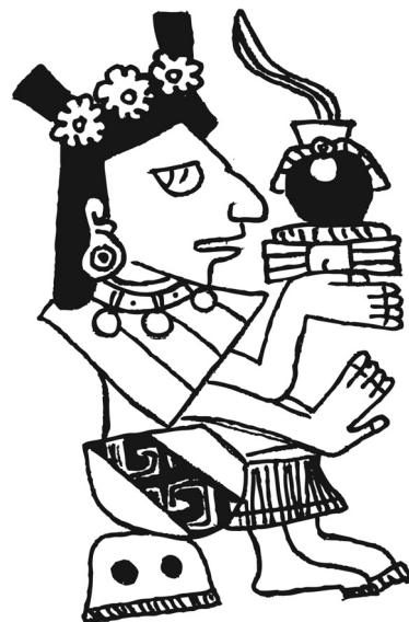
Fig. 3 Guirnaldas de flores como el adorno de cabeza. Códice Borgia (lám. 58). Redibujado por Agnieszka Brylak.

En algunas láminas, sin embargo, encontramos el ornamento de cabeza pintado de forma mucho menos refinada (cf. Fig. 3), con los elementos particulares (¿flores? ¿ momochitl ?) reducidos a unos círculos blancos con puntos rojos en medio ( Códice Borgia 1993: láms. 27, 28, 53, 20; Figs. 5.a-b.). Anders, Jansen y Reyes García identifican a las divinidades de las láminas 27-28 del Códice Borgia con Chantico, Chalchiuhtlicue, Diosa del Maíz y Princesas Semillas respectivamente, identificando el material del que están hechos sus diademas con perlas ( Códice Borgia 1993: 173-174). No obstante, nos parece que en el caso de las imágenes de la Fig. 5 es posible que tengamos que ver con las representaciones de atavíos de maíz tostado. Hay varios argumentos por los cuales nos inclinamos hacia esta interpretación.