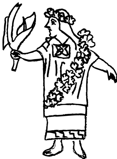
Fig. 2 Representación de una participante en las fiesta de Toxcatl con el adorno de maíz tostado. Durán (2006 I: lám. 10). Redibujado por Agnieszka Brylak.

Izquixochitl , enumerada por los informantes de Sahagún entre las flores preciosas ( CF XII: 43), con mucha frecuencia aparece en la poesía, a menudo componiendo un binomio con otra especie, cacahuaxochitl (“la flor de cacao”) (Sautron 2007). Según Johansson (2006: 82), es una de las metáforas para designar el sexo femenino y su belleza, en tanto que para Sautron el campo semántico que cubre es mucho más amplio y el vocablo puede simbolizar también la riqueza, el prestigio del poder, la valentía de los guerreros, en fin, todo lo valioso para el hombre (Sautron 2007: 248). De hecho, como señala Heyden (1983b: 42), el uso de las guirnaldas de maíz tostado en las fiestas religiosas nahuas estaba relacionado con dos dioses todopoderosos –Tezcatlipoca y Huitzilopochtli– y con la autoridad señorial 15 . Además, su significado a veces abarca también el mundo